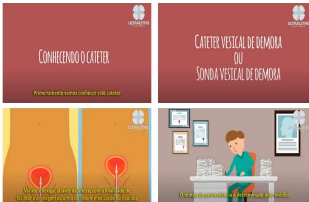
Figura 2 - Telas conhecendo o que é o CVD

As telas de 6 a 11 mostram a finalidade do cateter, o tempo de permanência, e fala do balão interno que faz com que o cateter não exteriorize facilmente.