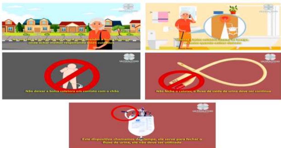
Figura 5 - Telas de outros cuidados com o CVD

As telas de 28 a 32 tratam de cuidados com cateter e bolsa coletora dentro e fora de casa como: manter a bolsa coletora abaixo do nível de bexiga, não deixar a bolsa coletora em contato com o chão, não fechar o cateter e não usar o clampe.