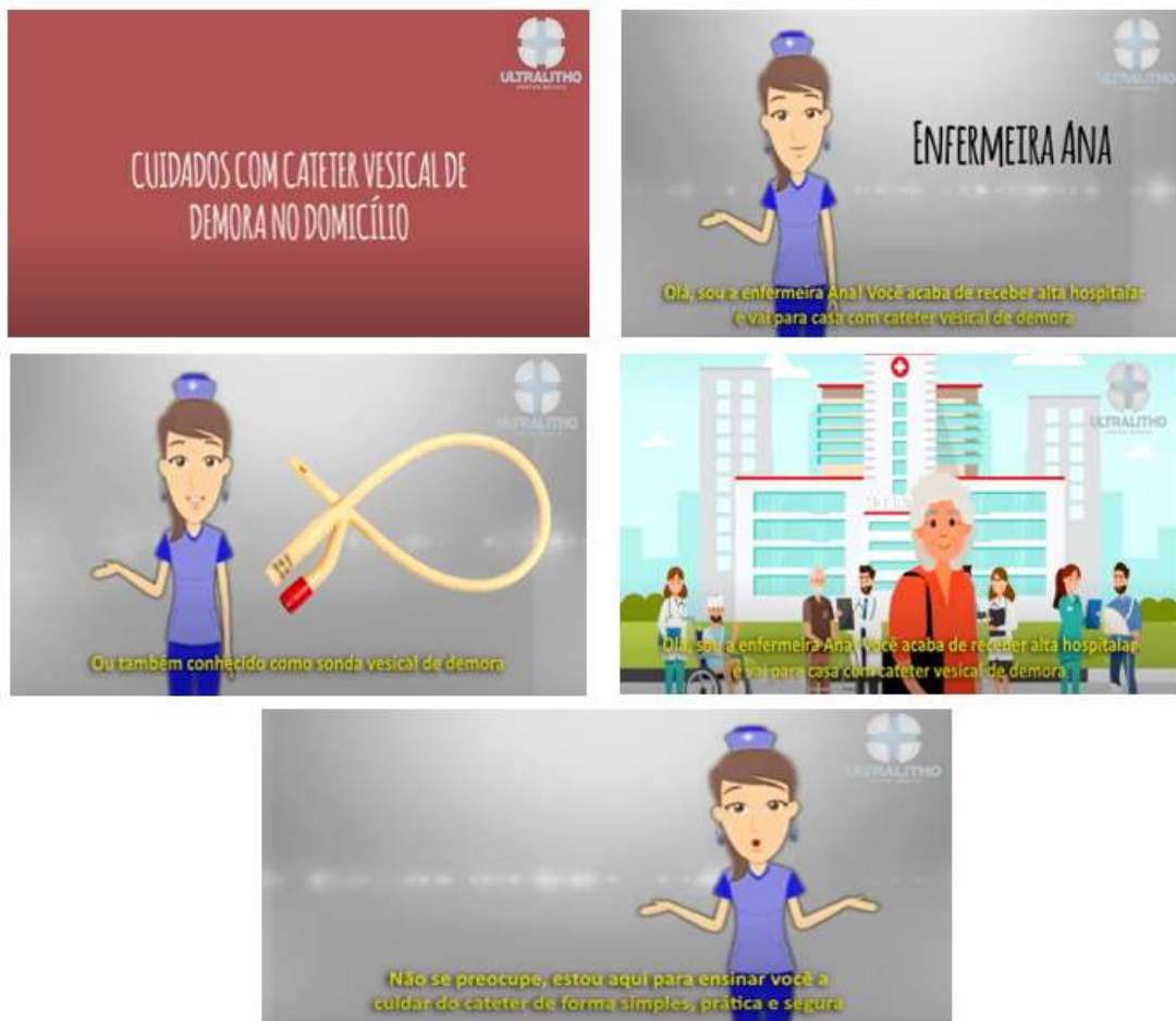
Figura 1 - Telas iniciais

As telas de 6 a 11 mostram a finalidade do cateter, o tempo de permanência, e fala do balão interno que faz com que o cateter não exteriorize facilmente.