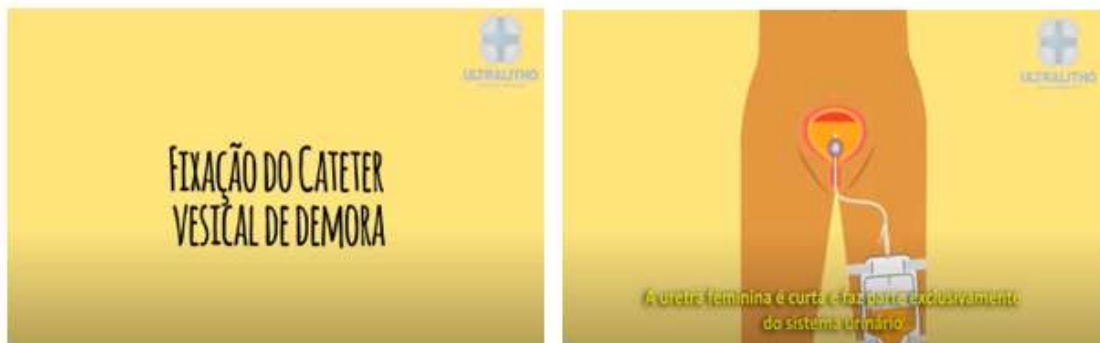
Figura 4 - Telas de fixação do CVD

As telas de 12 a 27 aborda-se a fixação do cateter, sua importância, como realiza a fixação, produto indicado para fixação, diferença entre o sexo masculino e feminino na fixação, tempo de troca da fixação e porque trocá-la.