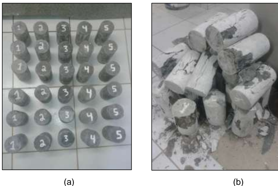
Figura 1. Corpos de prova : (a) antes do ensaio, (b) pós ensaios.

retificação mecânica. Utilizou-se a prensa de compressão da marca Emic e o software Tesc versão 3.04 para geração dos dados.