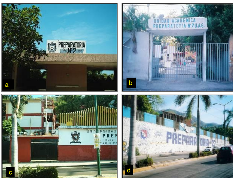
Figura 3. Preparatorias donde se realizó el estudio: a) Preparatoria 2, b) preparatoria 7, c) preparatoria 17, d) preparatoria 27

En la Figura 3 se observa la parte exterior de las preparatorias (2, 7, 17, y 27) donde se realizó la presente investigación, donde se realizó el diagnóstico sobre la situación ambiental que prevalece dentro de las mismas, así como sus entornos próximos.