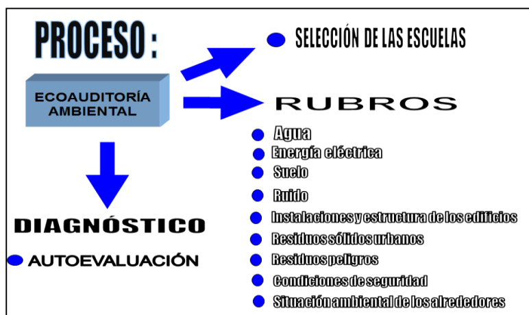
Figura 2. Matriz sistémica del proceso de la ecoauditoría ambiental en el estudio

manejo especial, ruido, suelo y subsuelo, riesgo ambiental, impacto ambiental, administración ambiental, entre otros (Figura 2).