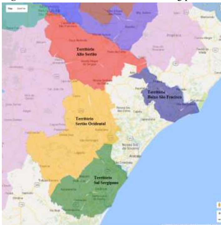
Figura 1 – Territórios da Cidadania em Sergipe.

O estado de Sergipe possui quatro Territórios da Cidadania (Alto Sertão, Baixo São Francisco, Sertão Ocidental e Sul Sergipano), como se verifica na figura 1, a seguir.