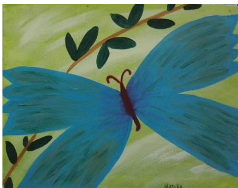
Libertad, 2017, óleo sobre lienzo, Natalia Villegas Saldarriaga

En un tercer momento del estudio, se pretendió poner el tema, bajo la mirada del arte, ya que como lo manifiesta Alcaide (2003):