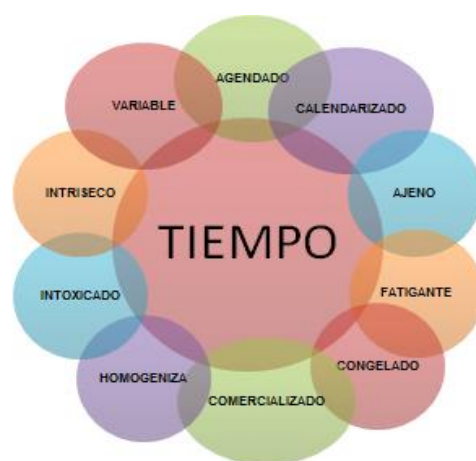
Figura 1. Tiempo, tiempos

Otra de las posturas de esta investigación tiene que ver con el tiempo colonizado, que se mueve, sin saber a dónde, ni para qué; también es pertinente señalar que no hay un solo tiempo, son varios: chrónos, aión, kairós y akairós por mencionar algunos. El tiempo varía según el sujeto y su relación con el mundo, las mujeres docentes, no solo acuñan muchos tiempos, también presentes: el de pareja, el de madre, el de hija, el laboral, dichos tiempos y presentes oscilan en todas las direcciones con un afán de sentir, de hacer, de programar un futuro sin visa y sin destino, donde finalmente no sabrán si es la meta deseada, en este sentido, es necesario exponer lo que plantea González (2015).