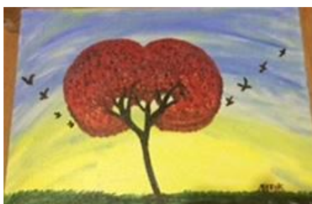
Amor y vuelo, 2017, óleo sobre lienzo, Natalia Villegas Saldarriaga.

En este apartado la investigadora le dará sentido a las voces femeninas en sus vivencias familiares y sociales, capítulo que tuvo influencia en el libro Nada, de la escritora Janne Teller, que sin duda alguna, permitió distinguir las certidumbres e incertidumbres de la mujer docente cuando su apretada y limitada agenda solo le susurra que tanto esfuerzo, nada vale la pena.