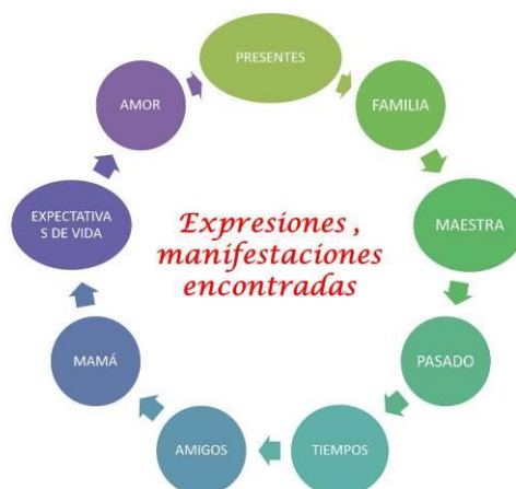
Figura 5. Expresiones del capítulo I Fuente. (Villegas, S. N.2018)

expectativas de juego, el parque era para los niños, yo representaba siempre a alguien mayor, a la maestra”. (Villegas, 2016)