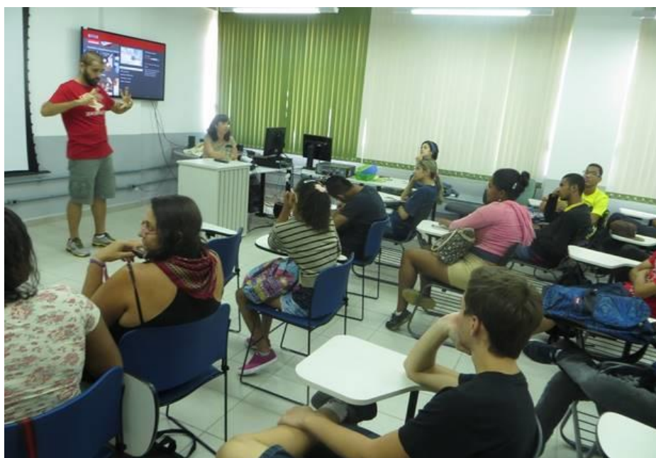
Imagem 3 - Estrutura de exibição dos filmes, com apoio do intérprete de Libras para mediar os debates.

Na plateia, estavam presentes tanto alunos surdos quanto ouvintes que reconheceram na história exibida sua própria experiência, conforme depoimentos dados ao final da sessão. A partir dos dados coletados, passa-se a análise dos dados, usando como base epistemológica a teoria crítica da Educação Ambiental.