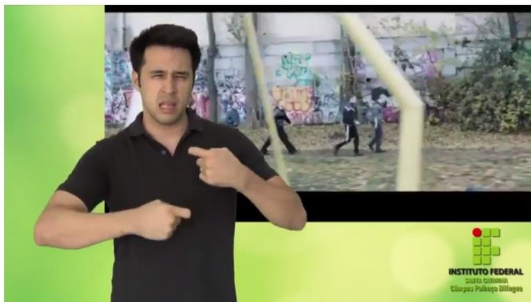
Imagem 1: Print da divulgação realizada para o filme A gangue, com a tradução da sinopse para a Libras. Disponível em https://www.youtube.com/watch?v=IVbxivMMwT8 .

sociais e visitas presenciais em algumas escolas que possuem surdos como alunos nos arredores.