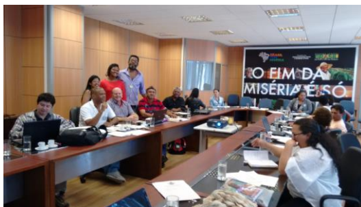
Figura 1: Reunião do GT Transição, Brasília, 2015.

Uma das estratégias fundamentais na garantia da luta política por visibilidade e de assento nos espaços formais de representação por parte de diferentes segmentos de Povos e Comunidades tradicionais foi a criação do GT Transição 15 . Os participantes do II Encontro de Povos e Comunidades Tradicionais 16 definiram pela criação de um Grupo de Trabalho para repensar a forma e as competências da CNPCT.