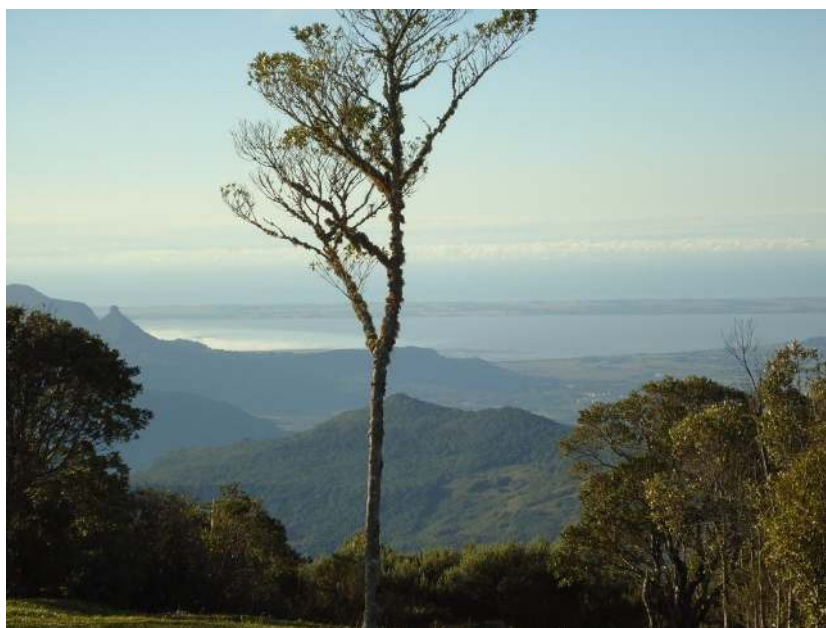
Imagem 1 – Área de grande beleza cênica.

ambientais, a sua espiritualidade e ao próximo. Durante o desenvolvimento do projeto, entre os anos 2012 e 2013, foram acompanhados nove grupos de significativa representação que frequentaram o local, sendo eles turmas da Rede Básica de Ensino de São Francisco de Paula e Porto Alegre, turmas de Graduação e Pós-graduação, visitantes internacionais da Universidade e funcionários da PUCRS.