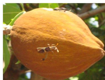
(detalhe focalizado pelas pesquisadoras.)