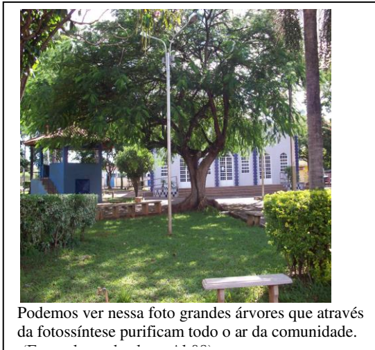
Podemos ver nessa foto grandes árvores que através da fotossíntese purificam todo o ar da comunidade.