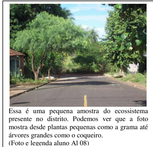
Essa é uma pequena amostra do ecossistema presente no distrito. Podemos ver que a foto mostra desde plantas pequenas como a grama até árvores grandes como o coqueiro. (Foto e legenda aluno Al 08)

As árvores e as outras plantas são apresentadas pelos alunos por sua importância para a comunidade e para o meio ambiente, uma vez que, nas legendas são mencionados alguns processos químicos que ocorrem na natureza e normalmente são ensinados na escola. Nesse sentido, as legendas das imagens se delimitam na ótica do conhecimento escolar. Barioni e Amorim, em pesquisa realizada em um bosque da cidade de Campinas- SP; questionaram as práticas de educação ambiental que valorizam o ambiente natural, enfatizando até que ponto esse é um ambiente natural, de natureza intocada, “vívda como ausência do humano” (2009, p. 191).