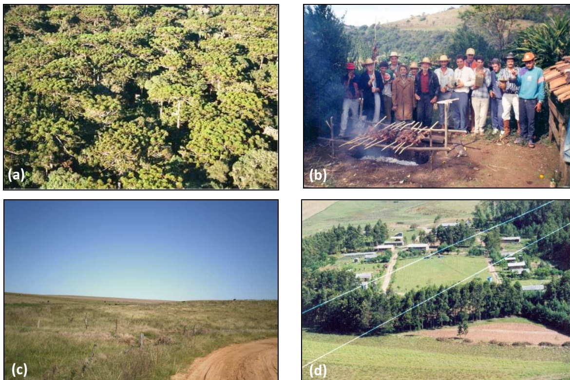
Figura 2. (a) Imagem ilustrativa da matriz da paisagem do lugar de origem. Floresta de Araucária do Parque Nacional das Araucárias, SC. Predominância do pinheiro-brasileiro ( Araucaria angustifolia ), Bioma Mata Atlântica. (b) Em destaque, membros de uma comunidade do lugar de origem na área do território indígena Cainguangue no município de Engenho Velho, RS. Ao fundo florestas de encosta em mosaico com campos cultivados. (c) Matriz da paisagem do lugar de destino em Santana do Livramento, RS. Campos com a predominância de gramíneas, Bioma Pampa. Ao fundo a presença de gado leiteiro. (d) Imagem área da agrovila de um assentamento, com campos cultivados no entorno, Santana do Livramento, RS.