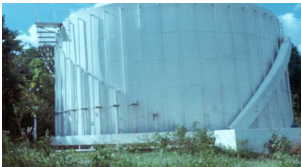
FIGURA 03 - GENARO (2004) - Biodigestor, bairro Três Barras, Cuiabá-MT.

Em Cuiabá-MT, o sistema de redes coletoras de esgoto somam aproximadamente 560 Km de extensão, nos diâmetros de 150mm a 400mm, em materiais tipo pvc e manilha cerâmica. Os ramais domiciliares cadastrados somam 48.000 unidades e em fase de cadastramento mais 15.000 unidades do sistema misto,