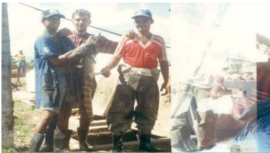
FIGURA 09 - Animais presentes nas lagoas de estabilização de esgoto, bairro Tijucal, Cuiabá-MT.

A presença destes tipos de animais nas ETEs e lagoas de estabilização é constante, escondem-se entre pedras, nos espaços das placas de concreto que circundam a lagoa, e na vegetação rasteira dos taludes. Os mais comuns encontrados são as aranhas, cobras, escorpiões e jacarés. Quando picado pela aranha o trabalhador deve ser removido imediatamente a um médico, procurando identificar o animal para facilitar a administração do soro antídoto. Quando o trabalhador é picado pela cobra, apresenta alguns sintomas, tais como, inchaço, náuseas e vômitos, perda de visão, expulsão de sangue. A utilização de botas até o joelho reduz a uma proteção de até 80% dos acidentes. Manter limpo os taludes das lagoas retirando matagal e folhas secas é recomendado. Procurar médico em caso de picadas e identificar o tipo de cobra para facilitar a administração do soro. Os escorpiões são animais de vida noturna, sua picada pode levar a óbito se não forem tomadas as providencias médicas. Identificar o animal para facilitar a administração do antídoto. Os trabalhadores devem utilizar rigorosamente os EPIs.