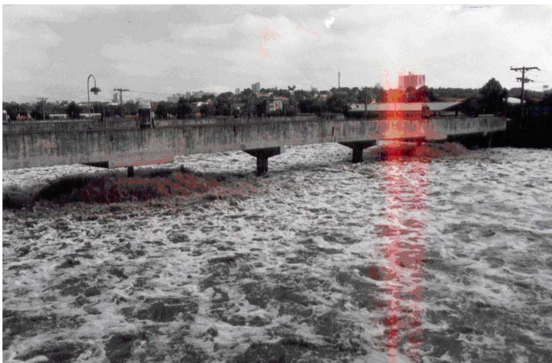
FIGURA 01 - GENARO (2004) - Tanque de aeração, ETE – Dom Aquino, Cuiabá-MT.

Na figura 01 é mostrado o tanque de aeração da ETE – Dom Aquino localizado na avenida Carmino de Campos. Este ponto serviu para medição da presença dos aerodispersóides.