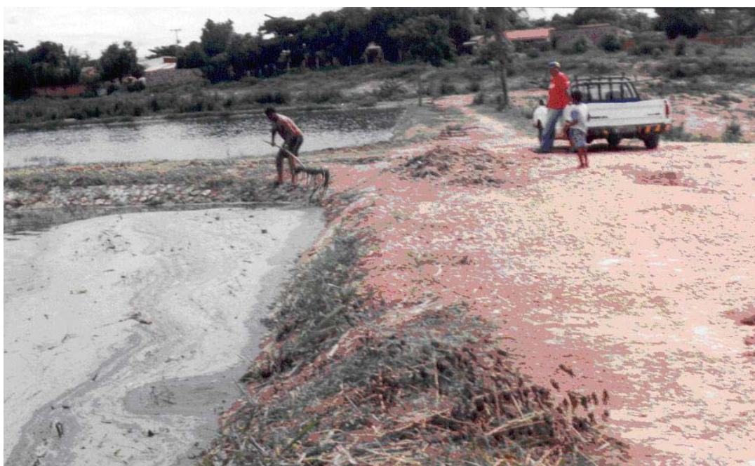
FIGURA 08 – GENARO (2004) - Limpeza da superfície da lagoa, CPA II, Cuiabá-MT.

Observou-se que os EPIs necessários nestes serviços são botas de cano longo, luvas plásticas, luvas de raspa, óculos, perneira e máscara descartável.