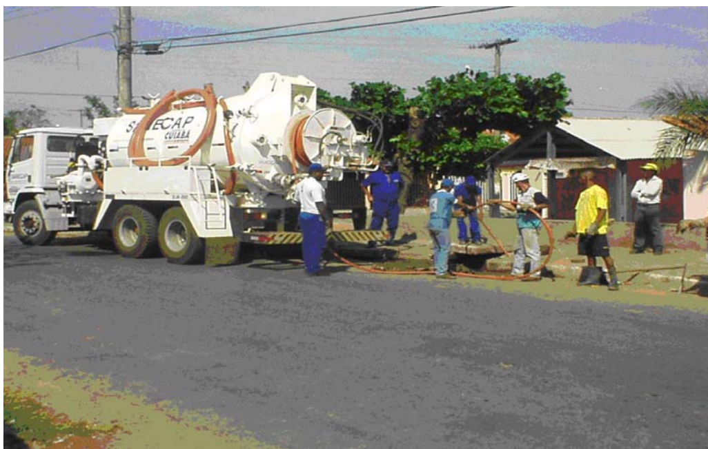
FIGURA 05 - GENARO (2004) - Veículo jato/vácuo de alta pressão para desobstrução de redes e ramais, Cuiabá-MT.

maior rendimento e segurança. A Companhia de Saneamento da Capital conta com veículos tipo jato/vácuo combinado, operando com jato de alta pressão e cortadores para a desobstrução de redes e ramais coletores, aumentando a praticidade dos serviços, reduzindo o contato direto do trabalhador com o esgoto conforme mostra a figura 05.