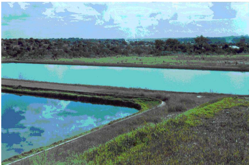
FIGURA 02 - GENARO (2004) - Lagoas de estabilização, bairro Tijucal, Cuiabá-MT. Na figura 03 é mostrado o tratamento de esgoto através de biodigestor, localizado no bairro Três Barras.