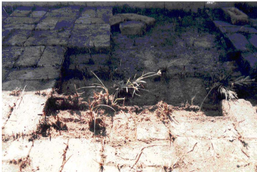
FIGURA 07 - GENARO (2004) - Remoção de alvenaria do fundo do leito de secagem, ETE Parque Universitário – Cuiabá-MT.