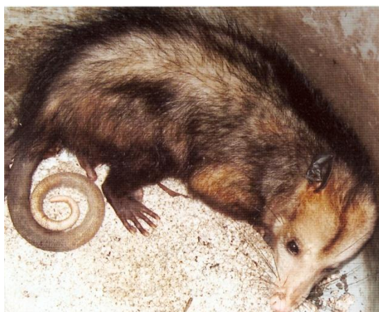
Figura 1 – A. Callithrix kuhlii . B. Callithrix penicillata . C. Callithrix jacchus . D. Potos flavus . E. Nasua nasua . F. Didelphis aurita .