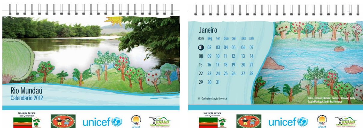
Calendário Rio Mundaú 2012 ilustrado com desenhos elaborados pelos participantes do ciclo de oficinas “Caminho das Águas”.