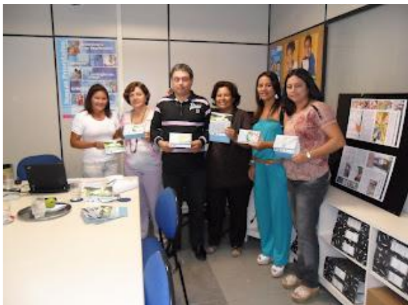
Figura 4 – Equipe da Sala Verde Serrana dos Quilombos em visita técnica ao escritório do UNICEF em Recife para entrega de calendários temáticos elaborados com base nos desenhos produzidos ao longo do ciclo de oficinas “Caminho das Águas”.

oportunidade de discutir os resultados parciais obtidos nas oficinas com técnicos do escritório do UNICEF na cidade de Recife, firmando nestas reuniões uma parceria que culminou com a editoração do Calendário rio Mundaú 2012, ilustrado com desenhos elaborados nas oficinas, que veio a ser publicado pela Secretaria Municipal de Educação de União dos Palmares.