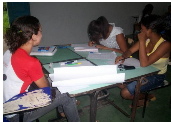
Ciclo de oficinas “Caminho das Águas”.