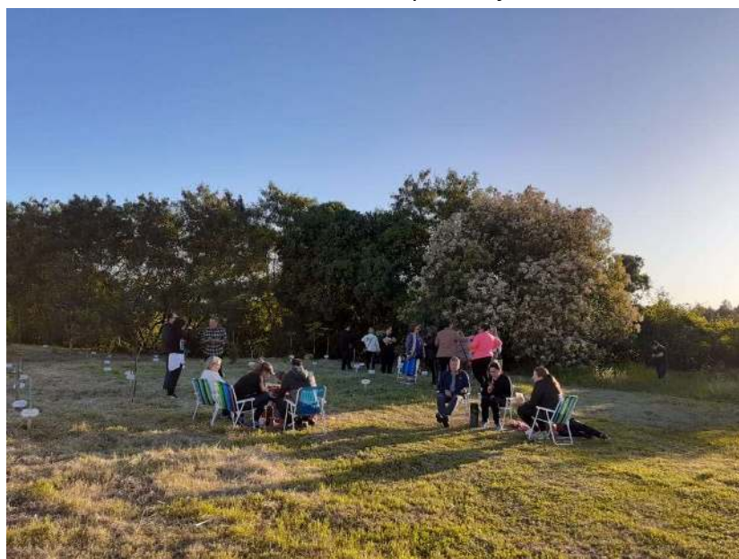
Figura III: Atividade alusiva ao Dia de Finados, em novembro de 2023, no Bosque da Memória no Município de Ijuí/RS.