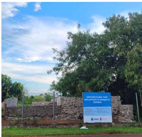
Figura II: Placa de formalização da execução global do Bosque da Memória no Município de Ijuí/RS.