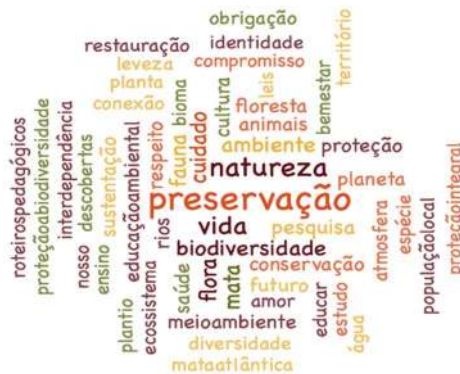
Figura III: Nuvem de palavras a partir das respostas à pergunta "Escreva 3 palavras que te vem à mente quando você pensa em uma Unidade de Conservação".

Perguntamos também quais as 3 primeiras palavras que vinham à mente quando pensavam em UC, cujo resultado está representado na figura III. Em evidência (no centro) figuram as palavras preservação, natureza e vida, seguido de biodiversidade, cuidado, conservação, fauna, flora e pesquisa, termos próximos de uma visão conservacionista das UC. Também aparecem, em menor frequência, palavras como população, interdependência, educar, território, cultura e identidade que representam territorialidade e a complexidade de significados relacionados a esses territórios.