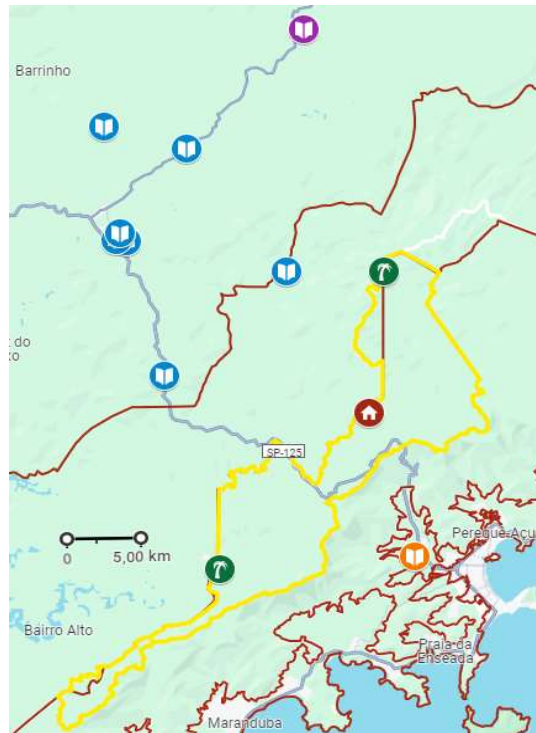
Figura II: Mapa com a localização das escolas dos docentes participantes do curso. Ícones em azul localizam as escolas de São Luiz do Paraitinga, em roxo a escola de Lagoinha e em laranja a de Ubatuba. Em vermelho a Sede do PESH/NSV, em verde as suas duas bases vinculadas, em Catuçaba ao norte e Vargem Grande ao sul. O tracejado amarelo delimita a área do PESH/NSV e em vermelho a zona de amortecimento do PESH.