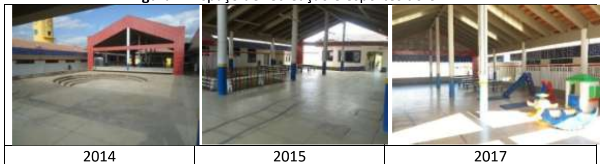
Figura 7: Espaço de recreação e esportes do CEMEI

Na categoria Espaço de recreação e esportes, verificou-se que não houve mudanças nas escolas públicas urbanas de Portalegre em comparação aos anos anteriores pesquisados. Em destaque, o CEMEI, por apresentar melhor espaço de recreação e esporte (FIGURA 7).