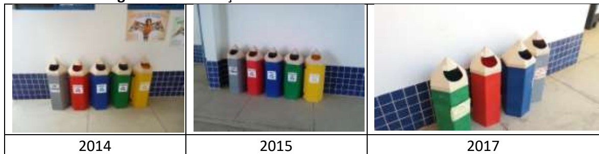
Figura 11: Destinação dos resíduos sólidos da Escola CEMEI

Na categoria destinação dos resíduos sólidos, todas as escolas da zona urbana possuem coletores em seus ambientes escolares, no entanto, a prática de separação não faz parte da comunidade escolar, assim como do município, que também não conta com coleta seletiva. A seguir, a Escola CEMEI (FIGURA 11) com coletores figurativos.