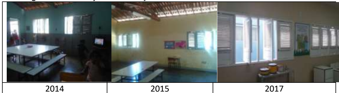
Figura 16: Ventilação e iluminação da Escola Francelino José do Nascimento

problemas de estrutura, janelas quebradas, lâmpadas queimadas e ventiladores quebrados. Na figura 16 é exposta a situação em relação à iluminação e ventilação da Escola Francelino José do Nascimento.