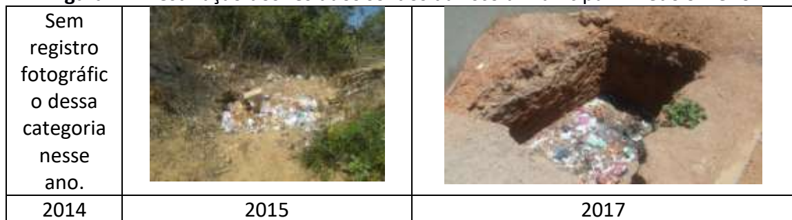
Figura 12: Destinação dos resíduos sólidos da Escola Municipal Alfredo Silvério

As escolas rurais apresentam uma realidade diferente das urbanas com relação ao destino dos resíduos sólidos, pois, todas elas, em todos os períodos pesquisados, permanecem com a prática das queimadas. Em destaque, a Escola Municipal Alfredo Silvério (FIGURA 12).