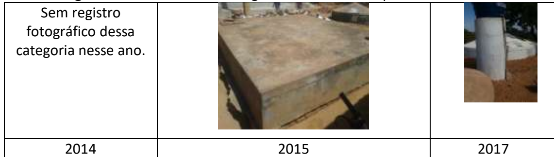
Figura 6: Armazenamento d’água da Escola Municipal Éneas Barbosa

Nas escolas rurais, todas receberam investimentos nessa categoria, o que permitiu mitigar os problemas de estrutura antiga, sem pintura, vazamentos e sem captação de água de chuva, contudo, a escola que apresentou mais mudanças nessa categoria foi a Escola Municipal Éneas Barbosa (FIGURA 6).