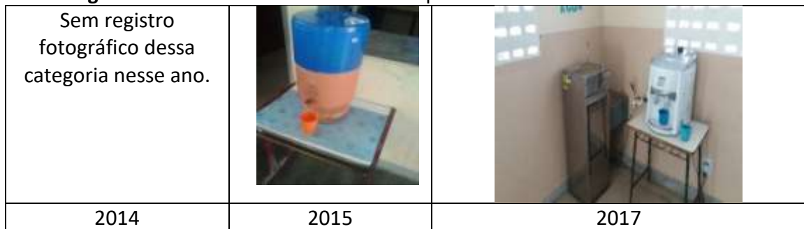
Figura 14: Bebedouro da Escola Municipal Francelino José do Nascimento