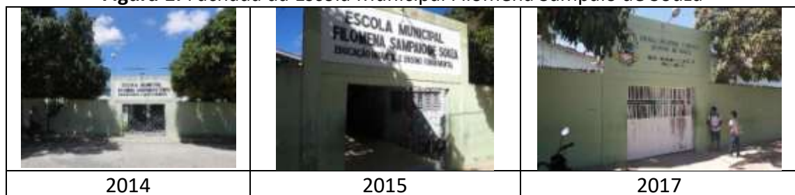
Figura 1: Fachada da Escola Municipal Filomena Sampaio de Souza

As fachadas das escolas públicas urbanas nos anos de 2014 e 2015 apresentavam uma estrutura antiga, sem identificação e pintura desgastada. No ano de 2017, verificamos melhorias nesse item, a exemplo da Escola Municipal Filomena Sampaio de Souza (FIGURA 1).