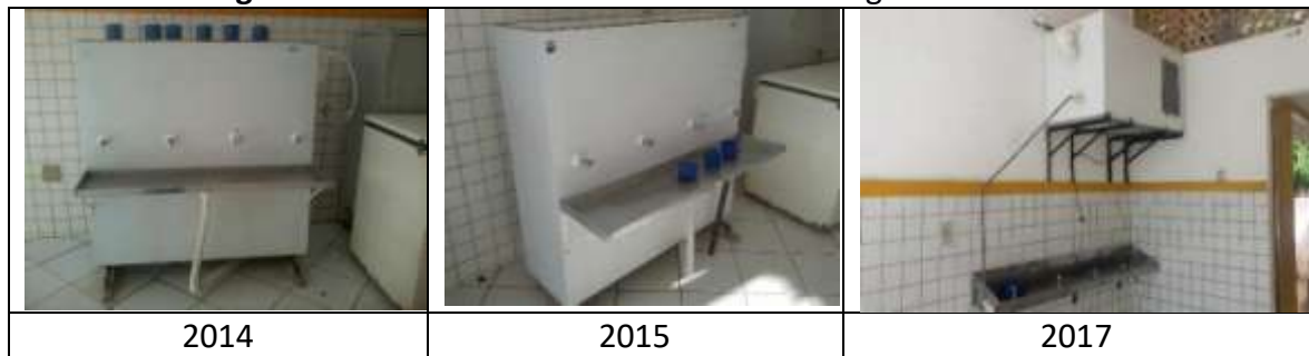
Figura 13: Bebedouro da Escola Estadual Margarida de Freitas