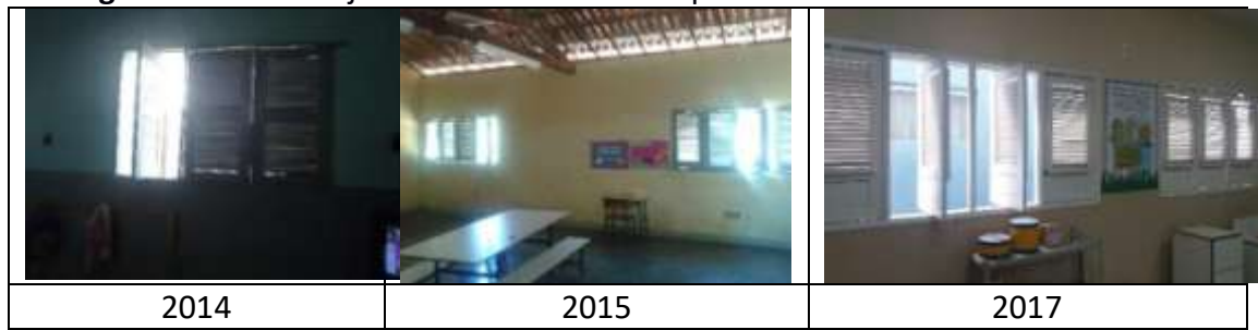
Figura 18: Portas e janelas da Escola Municipal Francelino José do Nascimento