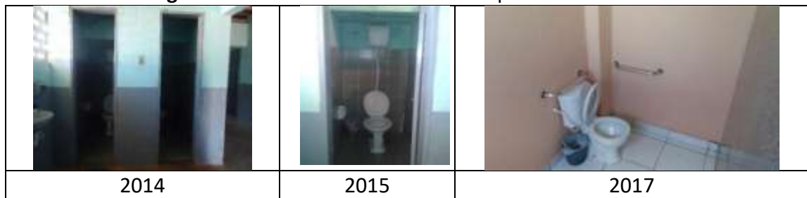
Figura 20: Banheiros da Escola Municipal Enéas Barbosa