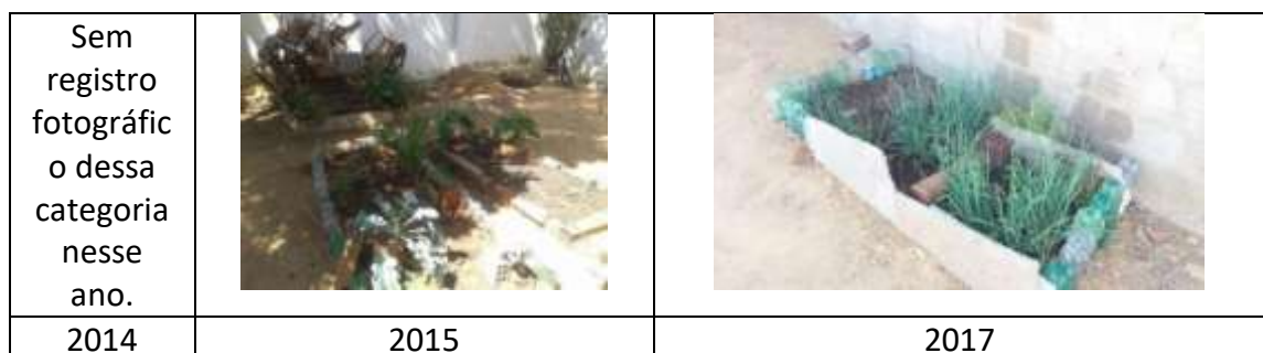
Figura 10: Horta escolar da Escola Municipal Francelino José do Nascimento

As escolas públicas rurais de Portalegre, na categoria horta escolar, não apresentaram cultivos em razão da crise hídrica no período da pesquisa, com exceção da Escola Municipal Francelino José do Nascimento (FIGURA 10). Entretanto, observamos que as hortas encontradas apresentavam estruturas antigas e irrigação incorreta e/ou ineficiente.