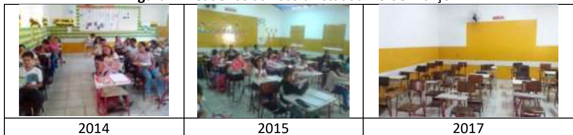
Figura 21: Cadeiras da Escola Estadual 29 de Março

Na categoria cadeira escolar, verificou-se que todas as escolas públicas urbanas e rurais apresentaram investimentos nessa categoria, todavia, utilizam, parcialmente, cadeiras novas e antigas. Ainda é comum encontrar cadeiras quebradas/desgastadas, sem pintura e ou cadeiras não adaptadas. A Escola Estadual 29 de Março (FIGURA 21) é a única escola urbana que necessita de mais investimentos nessa categoria, não apresentando mudanças significativas em relação aos anos anteriores pesquisados.