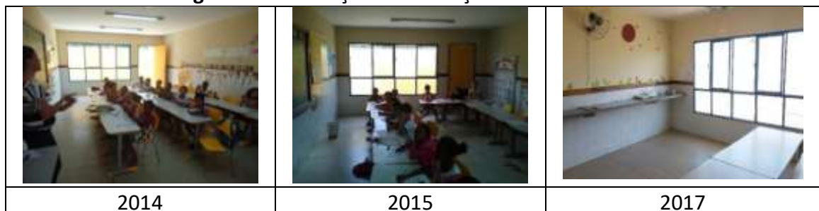
Figura 15: Ventilação e iluminação da Escola CEMEI

Na categoria de ventilação e iluminação das escolas públicas urbanas não houve alteração, ainda apresentaram, parcialmente, escolas com problemas de lâmpadas queimadas e/ou sem lâmpadas, janelas não adaptadas para o aproveitamento da luz solar, ventiladores quebrados e estrutura antiga. A escola que apresenta melhores condições físicas é a Escola CEMEI (FIGURA 15).