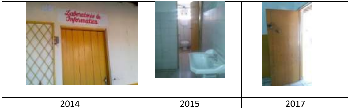
Figura 17: Portas e janelas da Escola Estadual 29 de Março

Com relação às condições da categoria portas e janelas das escolas públicas urbanas, três (3) instituições carecem de investimentos para a melhoria dessa categoria. Na sequência, a Escola Estadual 29 de Março, apresentando madeira antiga, não reflorestada e pintura antiga e/ou sem pintura (FIGURA 17).