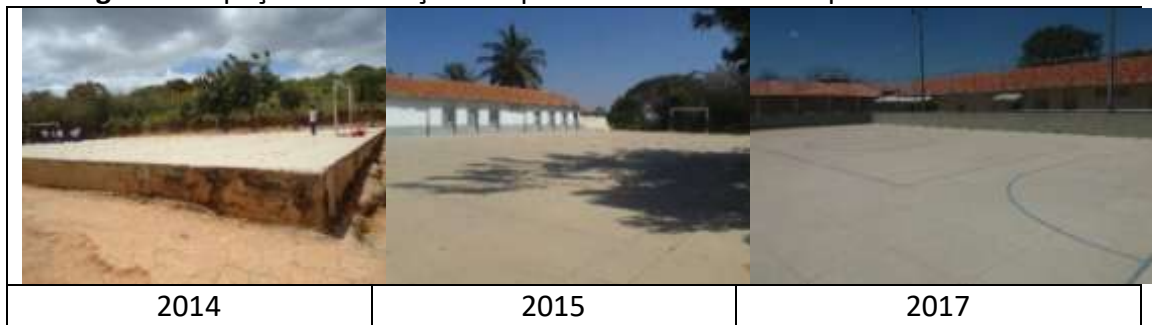
Figura 8: Espaço de recreação e esportes da Escola Municipal Alfredo Silvério