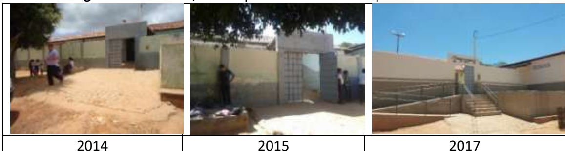
Figura 4: Escadas e/ou rampas da Escola Municipal Alfredo Silvério