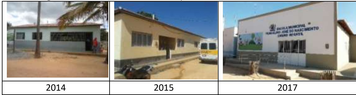
Figura 2: Fachada da Escola Municipal Francelino José do Nascimento