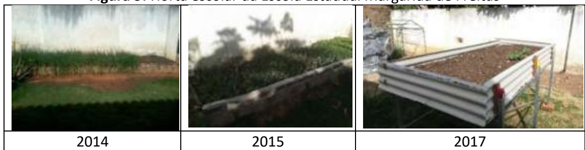
Figura 9: Horta escolar da Escola Estadual Margarida de Freitas

Na categoria horta escolar, verificou-se que as escolas públicas urbanas pararam de cultivá-las. Em destaque, a Escola Estadual Margarida de Freitas (FIGURA 9).