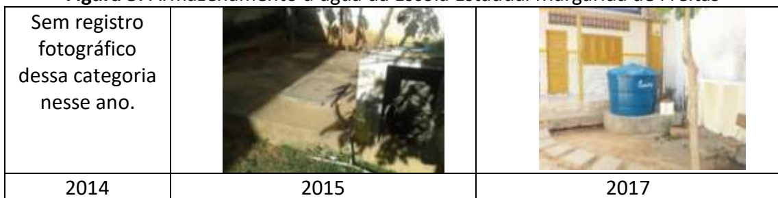
Figura 5: Armazenamento d'água da Escola Estadual Margarida de Freitas

Em seguida, na categoria armazenamento da água, observou-se que das escolas da zona urbana apenas uma (1) apresentou mudança em relação aos anos anteriores pesquisados, a Escola Estadual Margarida de Freitas (FIGURA 5), as demais, ainda, apresentam estruturas antigas com rachaduras, sem pintura e vazamentos.