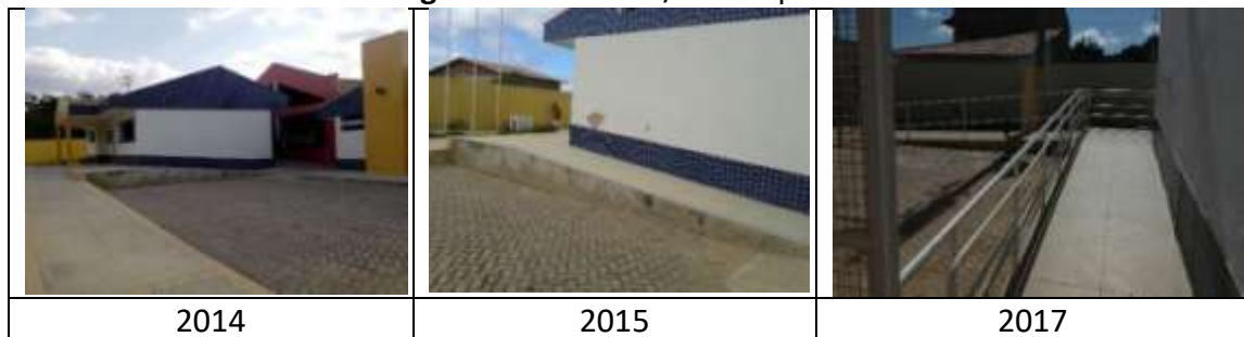
Figura 3: Escadas e/ou rampas do CEMEI

Na categoria escadas e/ou rampas, em todos os anos pesquisados, as escolas urbanas/rurais analisadas careciam de investimentos com relação às condições de acessibilidade: ausência de corrimão, ausência de pintura e piso tátil em algumas escolas. Verificou-se que a escola que obteve mais mudanças nesse quesito foi o Centro Municipal de Educação Infantil (CEMEI) (FIGURA 3), localizado na sede do município. Na zona rural a escola que apresentou melhorias nessa categoria, foi a Escola Municipal Alfredo Silvério (FIGURA 4).