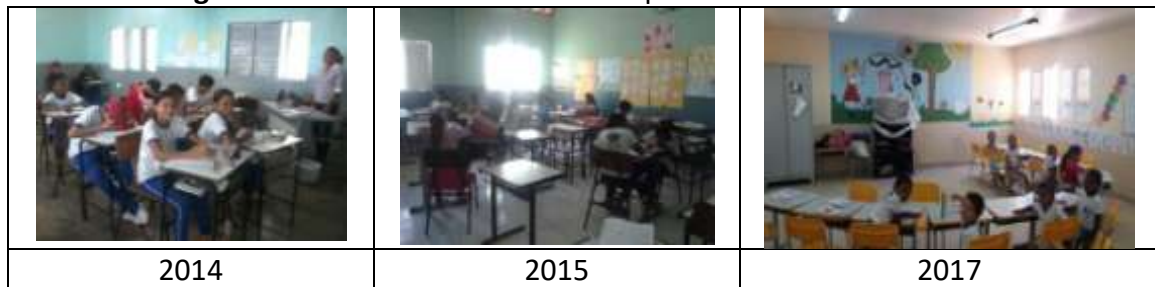
Figura 22: Cadeiras da Escola Municipal Elvira Gomes de Moura