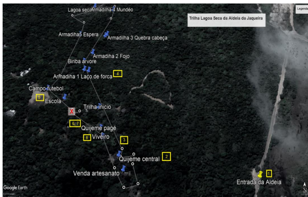
Figura 3: Mapa da trilha com os novos pontos

Os pontos de inclusão dos novos temas estão apresentados na Figura 3 e os temas apresentados na Tabela 1.