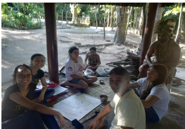
Figura 2: Reunião para apresentação dos novos temas para a trilha

O próximo encontro, em sala de aula, foi utilizado para a alteração e melhoria das propostas apresentadas no encontro com os indígenas. Foi definida uma proposta final que foi entregue para os indígenas da aldeia, como produto desse trabalho.