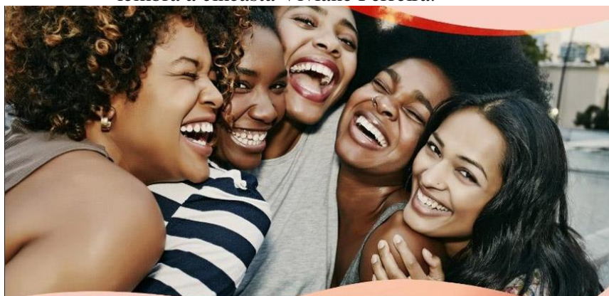
Figura 8: O direito de se sonhar como grupo no cinema é uma ferramenta política, como lembra a cineasta Viviane Ferreira.

As transformações já observadas estão relacionadas às possibilidades criadas com novos recursos tecnológicos e (também) pelas reivindicações e mobilizações de tais minorias. Para que essas mudanças continuem, é necessário debater como esse acesso pode se tornar ainda mais amplo, efetivando a cidadania em suas dimensões política, econômica, social e cultural, como aponta Cicilia Peruzzo (2005). A presença de lésbicas e bissexuais – jovens, idosas, de diferentes etnias – em séries para adolescentes fortalece a identidade dessas jovens. As produções já existentes e as planejadas, como Ufa! Falei! , com a presença de lésbicas e bissexuais tendo voz, proposta por Viviane Ferreira, colaboram para quebrar o silêncio ainda imposto a grupos minoritários. Tais mudanças, com representação e visibilidade na mídia, podem contribuir com o exercício do direito à comunicação e, assim, com a identidade e cidadania de lésbicas e mulheres bissexuais, de todas gerações, desde que consigam que as ferramentas percebidas como do senhor sejam apropriadas por todas as pessoas. Ainda que tentem nos atrasar, estamos seguras de que conseguiremos!