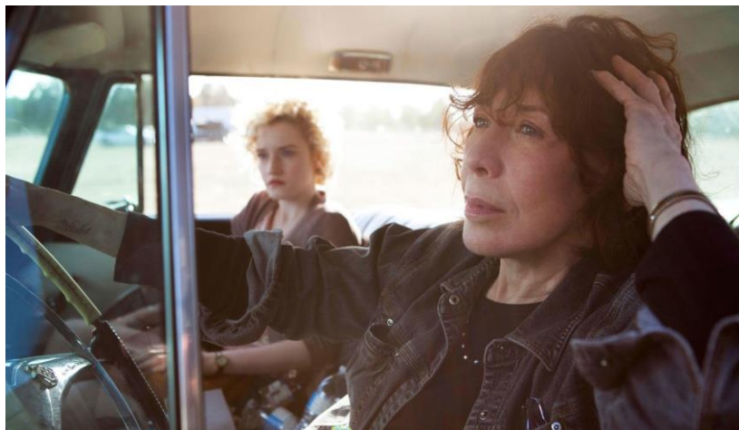
Figura 1: A avó interpretada por Lily Tomlin, com a neta, interpretada por Julia Garner