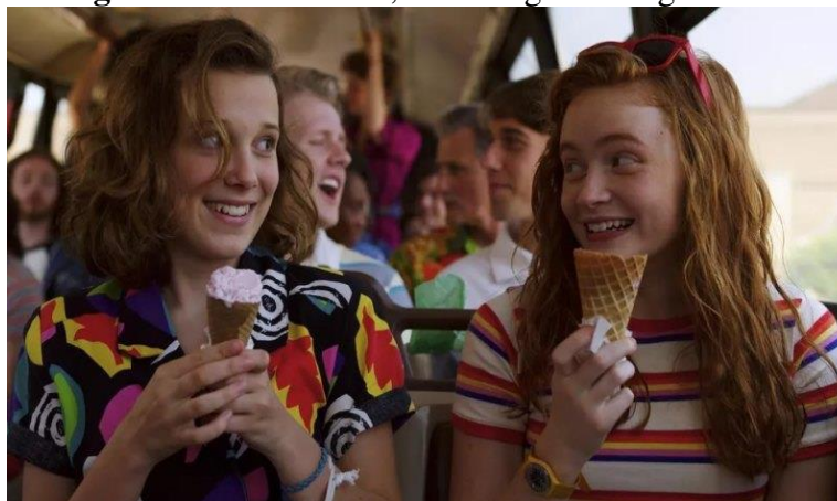
Figura : Eleven e Max, de Strangers Things

Nesta série é importante salientar a questão racial, uma vez que desde o lançamento do trailer da série (KINOCHECK INTERNACIONAL, 2018), ela recebeu comentários racistas condenando a suposta representação de um casal inter-racial. EverythingSucks! procura instrumentalizar a nostalgia, estratégia que é identificada como recorrente nas produções da empresa, de modo a seguir uma linha semelhante àquela observada em StrangerThings (2016-), conforme apontam Mayka Castellano e Melina Meimaridis (2017), ao refletirem sobre produção televisiva e instrumentalização da nostalgia, especialmente no caso das séries da Netflix.