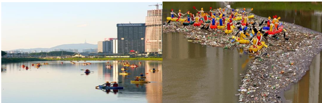
Figura 4: Fotografias de instalações referentes à obra Caiques , do artista plástico paulistano Eduardo Srur.