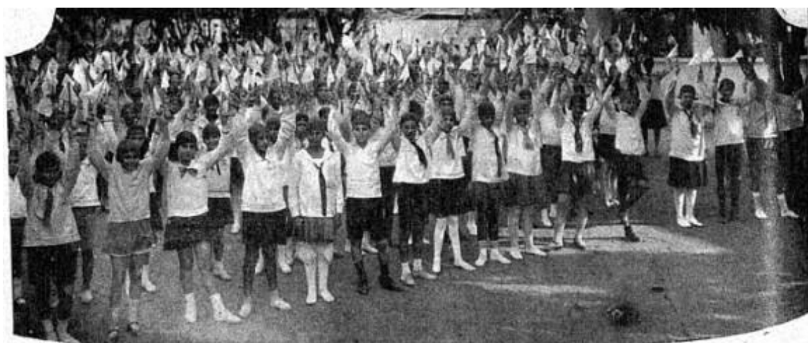
Figura 3 - “As alumnas em exercícios físicos, após a inauguração, sabbado á tarde”