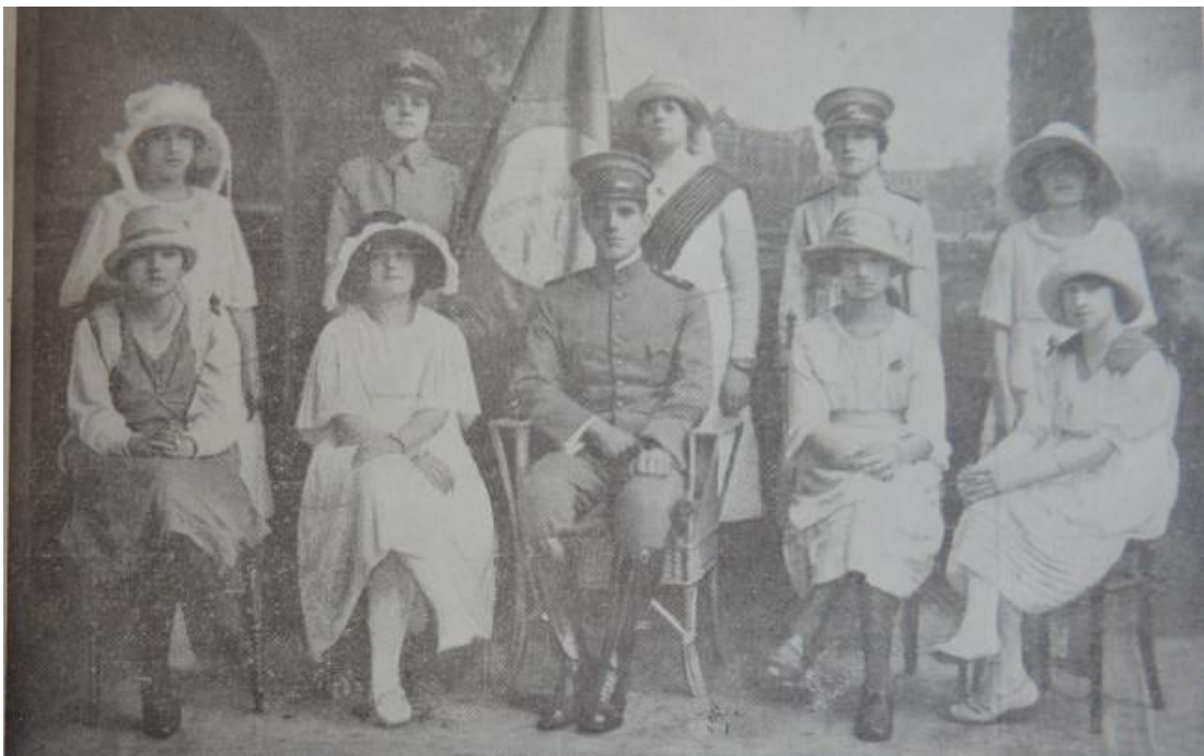
Figura 4 - “As disciplinadas atiradoras do Gymnasio Pelotense e seu dedicado instructor”