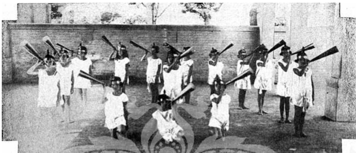
Figura 1 - “Alumnas do Grupo Delphim Moreira, de Juiz de Fora, executando a “Marcha da Aida” interessante gymnastica rythmica, por ocasião das festas commemorativas do 14 de julho realizadas naquella cidade mineira”