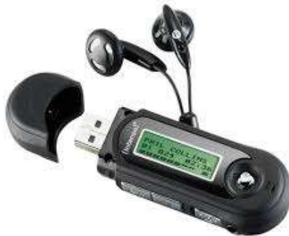
Figura 2 – MP3 player 3 .