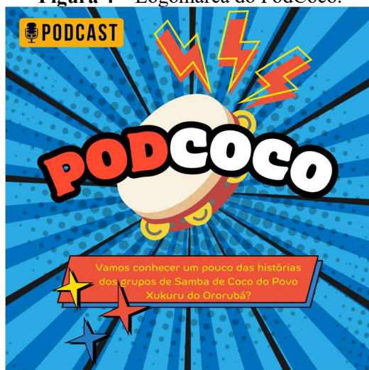
Figura 4 – Logomarca do PodCoco.

A primeira temporada do PodCoco foi composta por 8 episódios que versaram a respeito de uma mesma temática: os Sambas de Coco do Povo Indígena Xukuru do Ororubá. A seguir teceremos algumas considerações a respeito dos episódios de maneira geral.