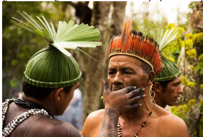
Figura 1 – guerreiros indígenas Xukuru do Ororubá preparando-se para o ritual.

Iniciamos nosso artigo com um toré do Povo Indígena Xukuru do Ororubá, que juntamente com outras 13 etnias compõem os povos indígenas contemporâneos do estado de Pernambuco. No último censo realizado pelo IBGE, no ano de 2022, foram contabilizados 106.634 indivíduos que se identificam como indígenas, somente em terras pernambucanas, com destaque para o município de Pesqueira-PE, sexto município em quantidade de indígenas a nível nacional, onde 22.728 pessoas se autodeclararam indígenas no ano de 2022 (Silva, 2023; Folha PE, 2023).