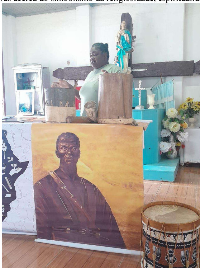
Imagem 2 – Narrativas acerca do simbolismo da religiosidade, espiritualidade e da cruz.

Joelita destaca o quão a cruz se tornou um símbolo de resistência do tempo, pois com o passar dos anos ela não se danificou, mas se solidificou, transformou-se em pedra, material maciço. Logo, “O símbolo da cruz, por exemplo, só pode ser interpretado, no caso de um bom cristão, de maneira cristã, a não ser que o sonho traga razões bem fortes em contrário” (JUNG, 2015, p. 101).