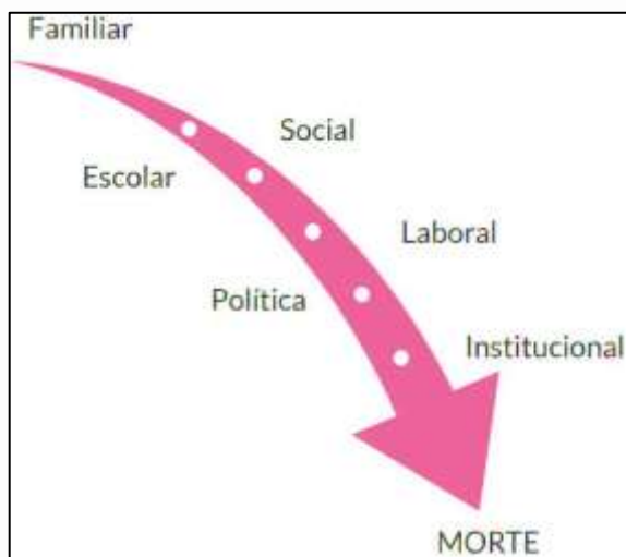
Figura 1: Ciclo das exclusões/violências transfóbicas