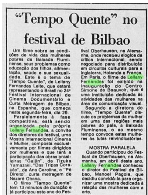
Diário do Paraná, 11 de janeiro de 1983

Tempo Quente é um documentário que alterna a experiência cotidiana de mulheres moradoras do bairro de Queimados com falas de militantes participantes de um Congresso de Mulheres. No filme de 13 minutos, a voz da personagem, mulher pobre e periférica, procura encontrar um espaço social de ressonância. O filme, segundo Leilany, traz “um painel da violência contra a mulher” (Jornal do Brasil, de 18/10/1981). O título retirado da fala inicial da personagem relaciona o calor sufocante à falta de perspectiva e às lembranças de uma história violenta: uma tentativa de estupro que sofreu em um ponto de ônibus: