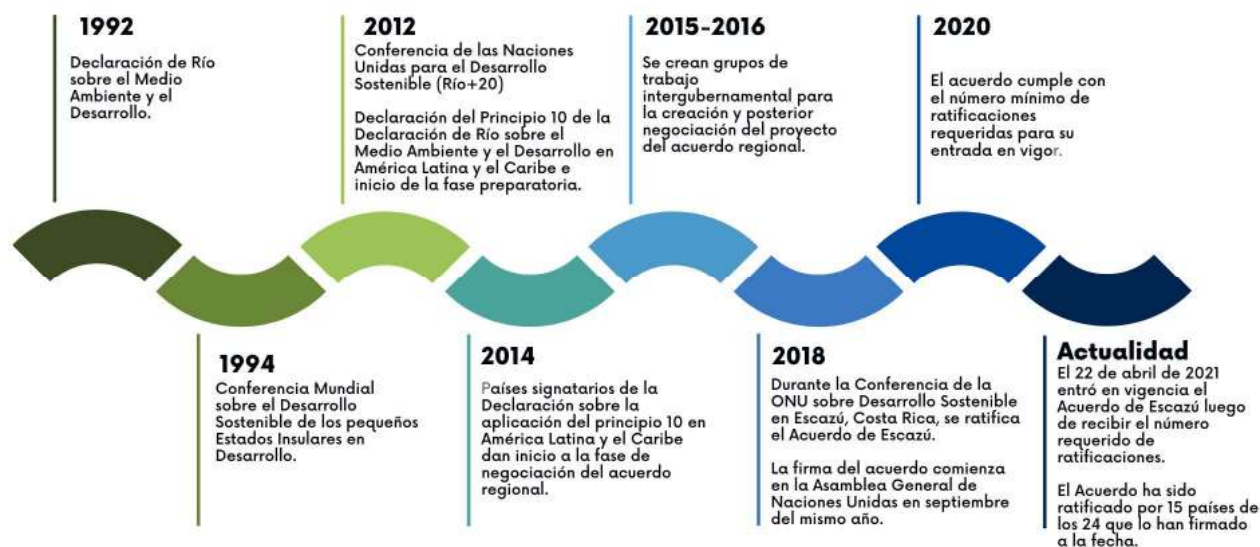
Figura 1 – Línea de tiempo del proceso de diseño y negociaciones para la construcción del Acuerdo de Escazú.

Es importante destacar la influencia de las demandas de los movimientos sociales, las organizaciones ambientalistas y los defensores de los derechos humanos para el desarrollo, el reconocimiento y entrada en vigor del Acuerdo de Escazú. Estos actores hicieron énfasis en la importancia de garantizar la disponibilidad de información, la participación pública y la justicia en los problemas ambientales, así como la necesidad de proteger a los defensores ambientales de las amenazas y la violencia.