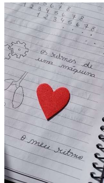
Imagem 3 – Foto Caderno