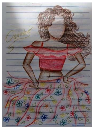
Imagem 5 – Caderno Poético – Bailarina do Carimbó