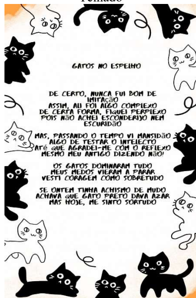
Imagem 1 – Card poema Gatos no Telhado