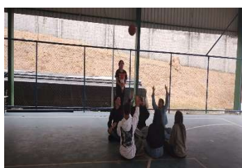
Basquete em cadeira de rodas