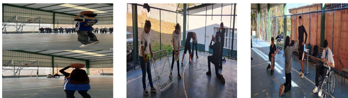
Imagem 4 – Fotos produzidas pelos(as) estudantes sobre os marcadores socioculturais que atravessam os esportes

Como um dos instrumentos de avaliação do semestre, solicitei que os(as) educandos(as) produzissem fotos de temas sobre o mundo esportivo que foram debatidos e marcaram as suas vidas de forma significativa.