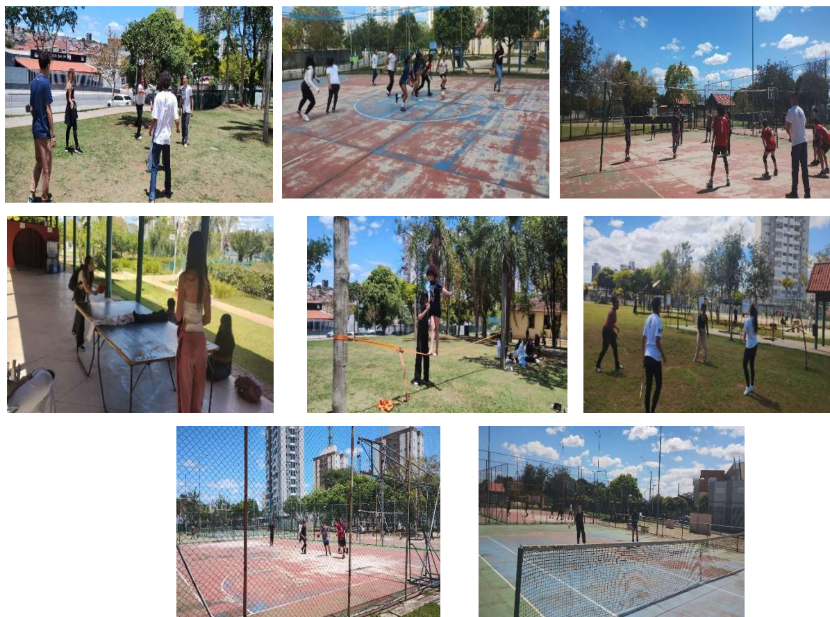
Imagem 4 – Vivências esportivas no parque da cidade de Jacareí