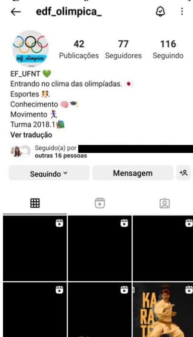
Imagem 03 – Página do Projeto de Intervenção no Instagram

Com base na experiência recente com a gravação de vídeos como recursos pedagógicos, a metodologia utilizada na aplicação do projeto foi caracterizada pela mesma sistemática, cujos vídeos (de caráter didático e explicativo) foram postados semanalmente na rede social “Instagram” (Imagem 03). Dessa forma, as 42 modalidades olímpicas foram divididas entre os quatro grupos de estagiários.