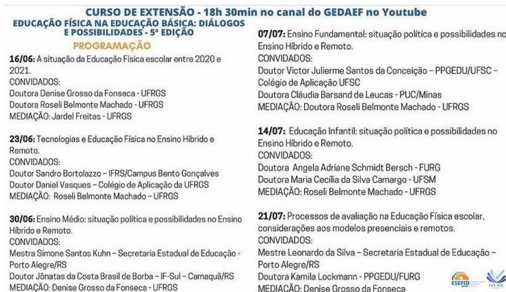
Imagem 2 – Folder de Divulgação do Curso 2021