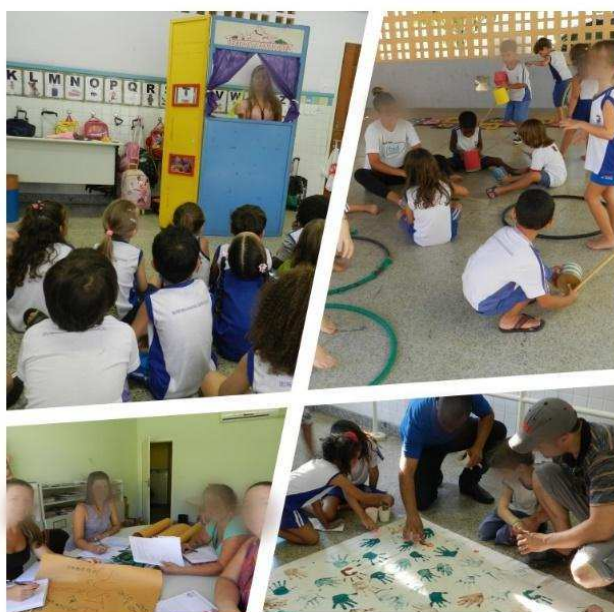
Imagem 2 – Aproximação ao universo lúdico das crianças, aos sujeitos escolares e famílias.

Dentre as ações operacionalizadas pela EF estão a aproximação ao universo lúdico das culturas infantis, a participação em reuniões pedagógicas, o envolvimento com as famílias e o diálogo com as professoras de sala, conforme pode ser observado na Imagem 2.