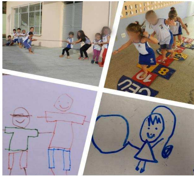
Imagem 3 – Desenhos e brincadeiras das crianças