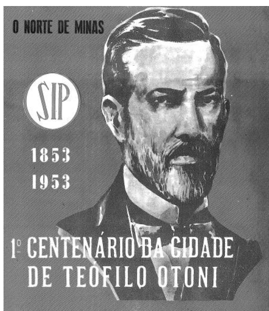
O Norte de Minas, 06.09.1953: Página comemorativa do Centenário da cidade de Teófilo Ottoni.