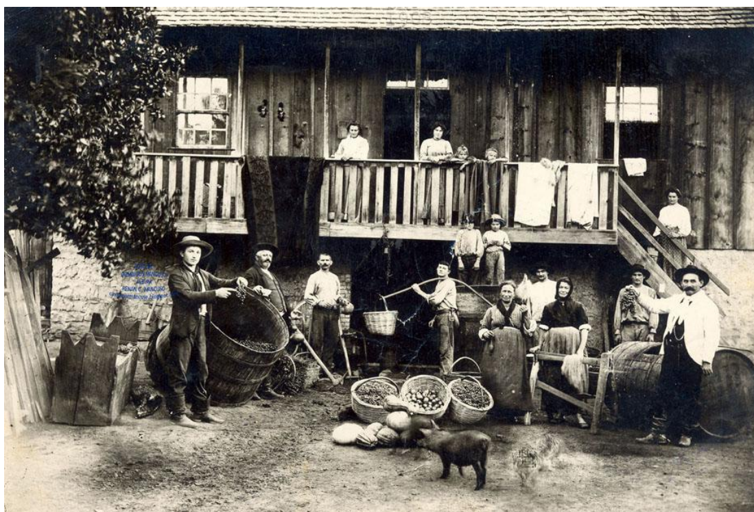
Foto 2 Família imigrante e a abundância