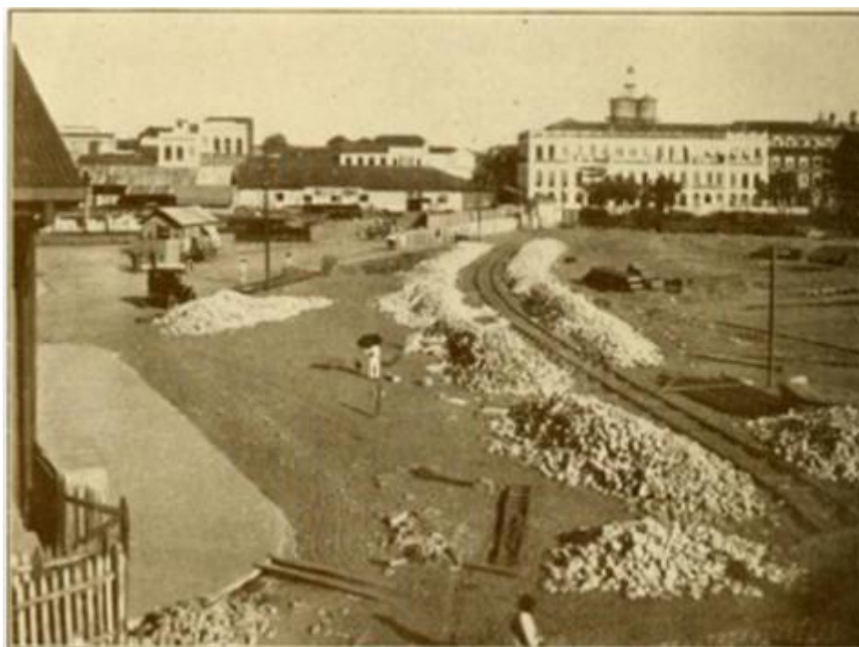
Figura 02 - Área aterrada do Boulevard da República na primeira secção

A Folha do Norte anunciava com o título em letras maiúsculas “AS OBRAS DO PORTO DE BELÉM” sobre o novo contrato assinado com Percival Farquhar para o melhoramento da obra tão aspirada, informando a população, sobre o contrato assinado que as obras serão destinadas aos serviços de carga, descarga, abrigo e guarda de mercadorias no porto desta capital. O projeto para o Porto de Belém, caracteriza-se como um plano de extensão com criação de novas áreas. As ampliações urbanas podem ser interpretadas como a vontade de projetar a totalidade da área urbana e geram o ordenamento morfológico e a organização dos serviços de infraestrutura. Em parte, está incluso o conceito de Haussmann: os bulevares do século XIX são artérias criadas para a circulação rápida, o tráfego pesado. O espaço haussmanniano é o espaço público – a rua, o passeio, as praças –, o espaço da mobilidade. Na cidade haussmanniana , é introduzida uma nova forma de construção da paisagem urbana. Constrói-se uma imagem urbana que se assemelhava à modernidade onde estavam vinculadas ao traçado e ao calçamento das vias públicas, a um novo tipo de arquitetura definida, em que o imóvel se integra no espaço público através de uma projeção regulamentada.