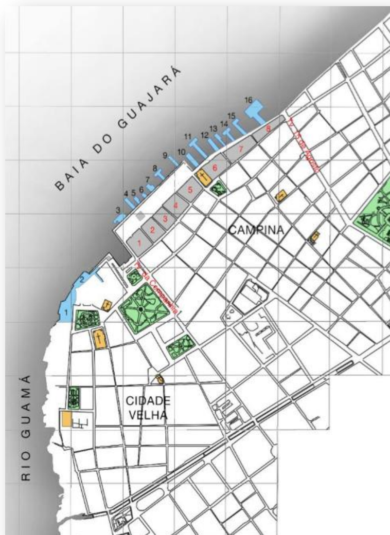
Figura 01: Mapa localizando a Rua Nova do Imperador com suas 08 quadras situadas no trecho entre a Tv. Da Companhia e Tv. 15 de Agosto e seus trapiches irregulares.

basicamente brasileiros ou aos que obtinham a autorização para poder entrar num vale de riquezas inexploradas, onde o governo brasileiro, queria manter pra si, onde Belém era porta de entrada de seus viajantes.