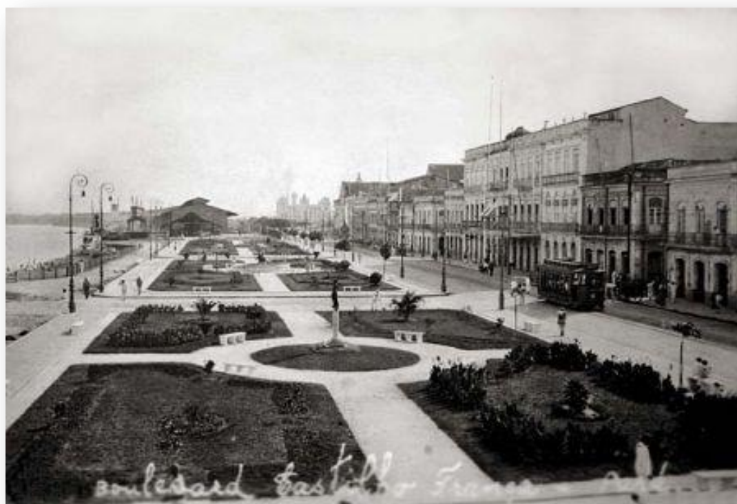
Figura 05: O emblemático Boulevard da Republica

No seu lado esquerdo, com o aterro da Port of Pará , ocorreu a construção de toda extensa muralha do cais, foram executadas obras de melhoramentos na área próxima ao Mercado de Ferro onde, ao seu lado, foram ajardinadas, calçadas, equipadas e iluminadas três quadras devolutas que passaram mais tarde a ser chamada de Praça dos Pescadores. Mais à frente, a construção de três grandes armazéns importados para recebimento e armazenamento de cargas, onde surgiram os gradis de ferro e os portões da travessa 15 de Agosto, na qual finda com outra praça ajardinada, mas tarde chamada de Praça dos Estivadores. O ferro subverteu a todas as heranças clássicas e permitiu que a arquitetura se libertasse da ditadura do belo, pertence ao caráter funcional da vida moderna. O estilo eclético e, mais tarde, o Art Nouveau , foram a criação de um espírito coletivo nas obras de inúmeros arquitetos, artistas e decoradores.