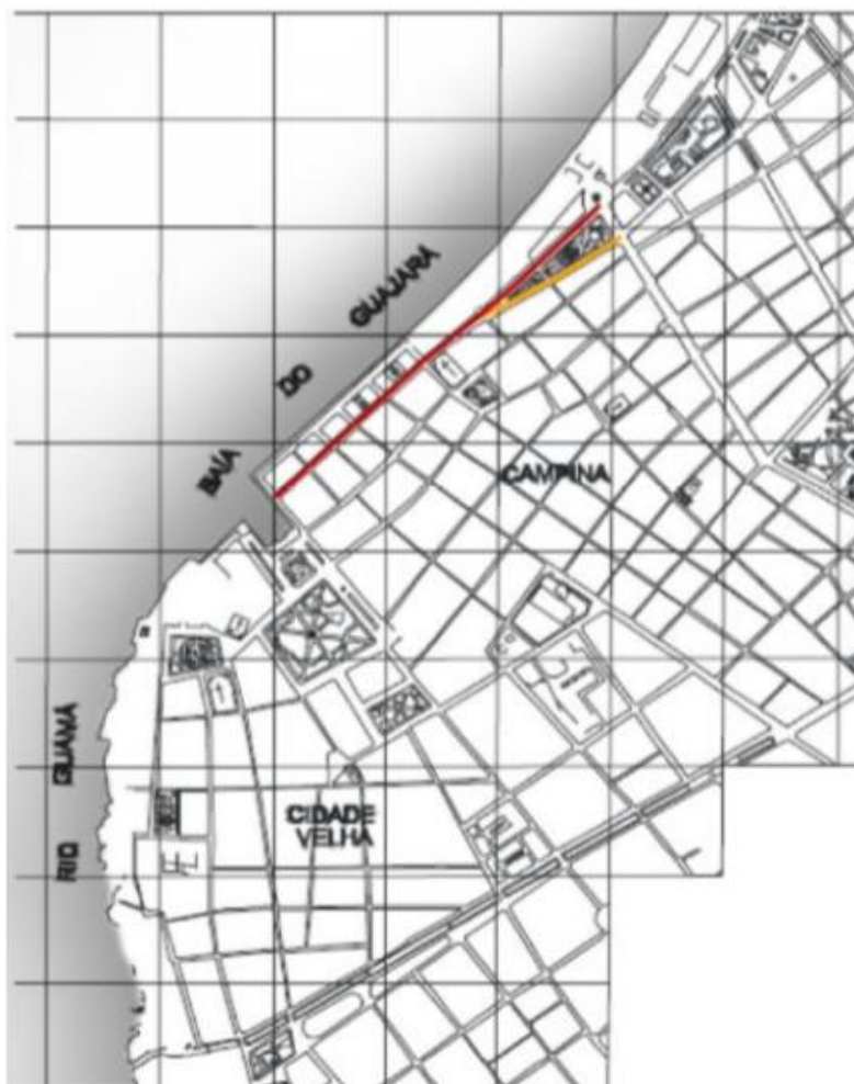
Figura 04 - Mapa localizando o Boulevard da Republica com sua nova configuração do litoral, situado no trecho entre as travessas da Companhia e 15 de Agosto com seu novo porto.