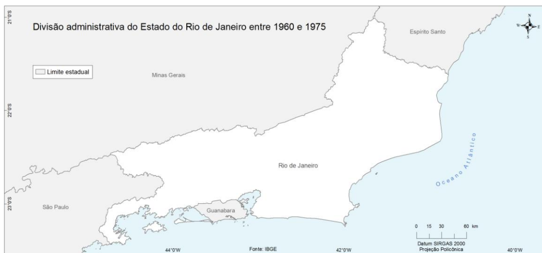
Mapa 2: Estados do Rio de Janeiro e da Guanabara entre 1960 e 1975.