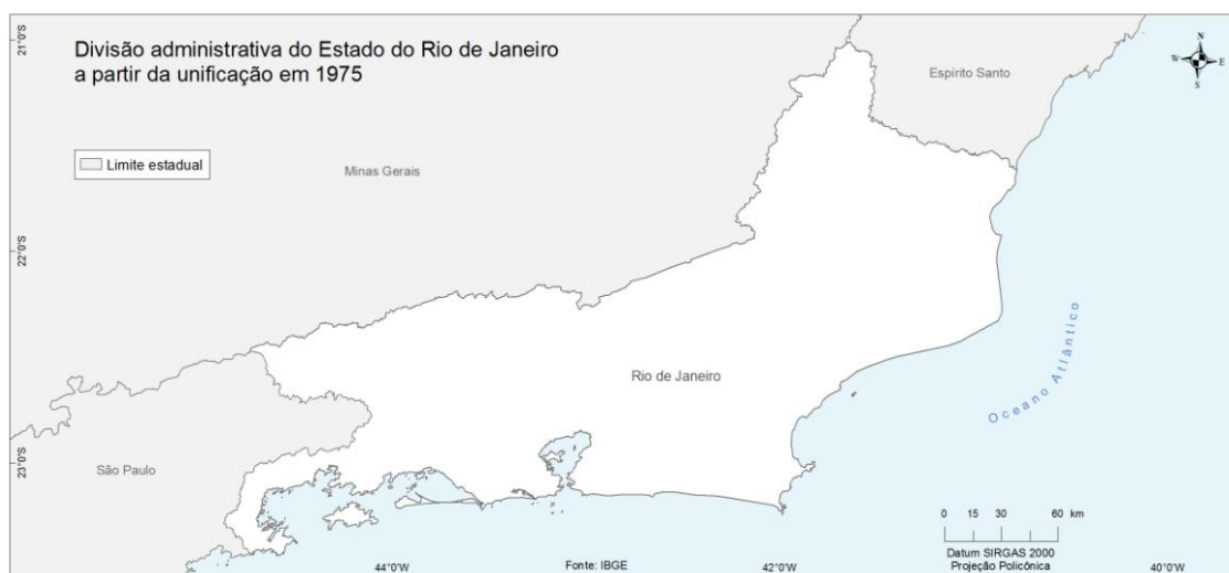
Mapa 3: Estado do Rio de Janeiro após a unificação (1975).