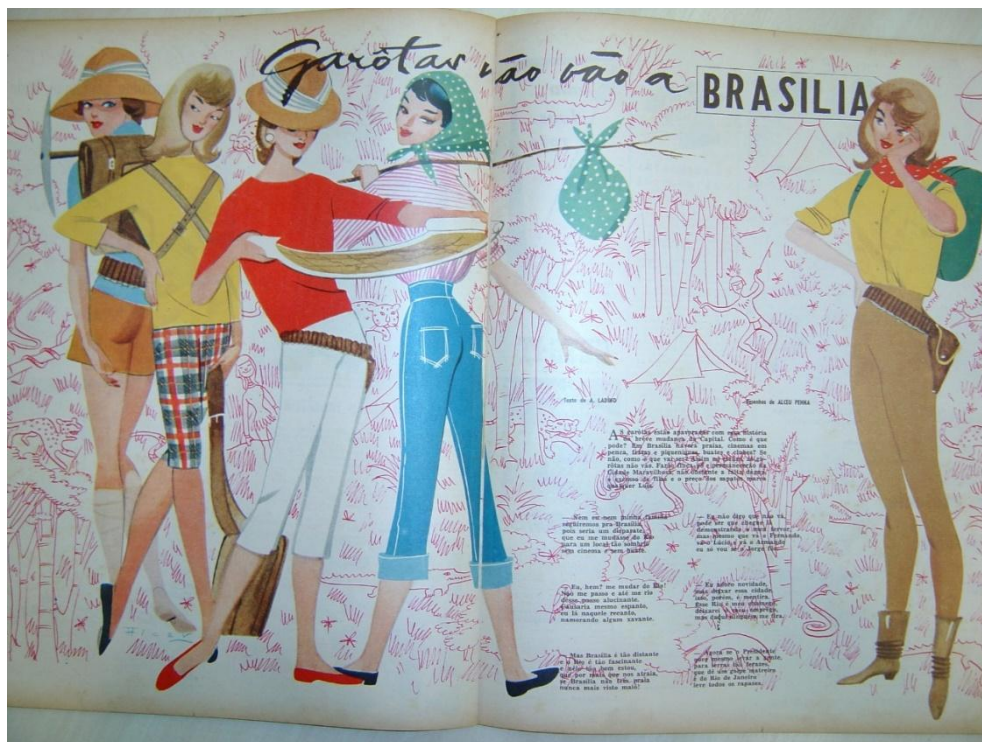
Figura 1 – Garotas não vão a Brasília – Revista O Cruzeiro 5 de julho de 1957.

As Garotas estão apavoradas com essa história da breve mudança da Capital. Como é que pode? Em Brasília, haverá praia, cinema empenca, festas, piqueniques, buates e clubes? Senão, como é que vai ser? Assim no escuro as garotas não vão. Farão finca-pé e permaneceram na Cidade Maravilhosa, não obstante a falta d'água, excesso de filas e o preço dos sapatos marca qualquer Luís (As Garotas não vão a Brasília. O Cruzeiro . 5 de julho de 1957).