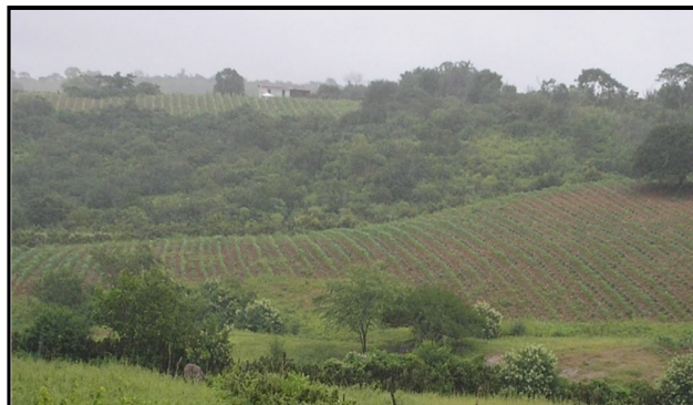
Foto: Plantações de milho, feijão e espaço de “mata” na Serra da Gameleira

feijão estendedor, o qual precisa ser plantado com nove palmos de distância de um para o outro para poder germinar. A imagem seguinte mostra o resultado do trabalho agrícola dos moradores da Serra.