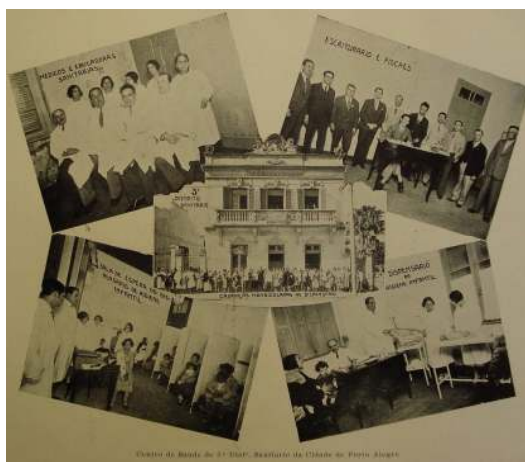
Imagem 3 - Centro de Saúde do 3º. Distrito Sanitário da Cidade de Porto Alegre

Quanto às imagens do 3º. Distrito Sanitário, o fotógrafo ou responsável pela edição das imagens parece querer representá-lo como sendo especializado em higiene infantil. Neste conjunto de imagens, aparecem mulheres com crianças no colo, em quase todas as fotos. Há também fotografias de mães com seus filhos em uma sala de espera, e crianças sendo atendidas no “Dispensário de Higiene Infantil”. As mulheres também têm destaque como funcionárias deste posto de saúde, no papel de educadoras sanitárias. Tais representações se repetem nas imagens do 4º. e 5º. Distrito. Nestes dois conjuntos de fotografias, também existem crianças sendo atendidas nos “Dispensários de Higiene Infantil”, porém, ao contrário do distrito anterior (cuja foto do atendimento demonstrava ser instantânea) estas imagens são nitidamente posadas. No 5º. Distrito, há ainda imagens de duas salas de espera diferentes, na mesma instituição: sala de espera do “Dispensário para o Tratamento das Moléstias Venéreas” e a sala de espera do “Dispensário de Higiene Infantil”. Tais imagens demonstram que mesmo oferecendo diferentes serviços, a instituição também oferecia ambientes diferenciados de espera para seu público, o que permitia que crianças não precisassem ter contato com adultos portadores de doenças venéreas.