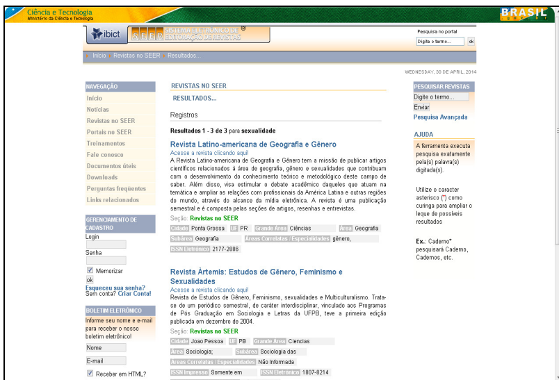
Figura 1 – Recuperação das revistas no Portal SEER com o termo sexualidade

A figura 1 ilustra a busca das revistas no portal ao utilizar-se o termo “sexualidade” e na tabela 1 apresenta o resultado da busca de todos os termos pesquisados.