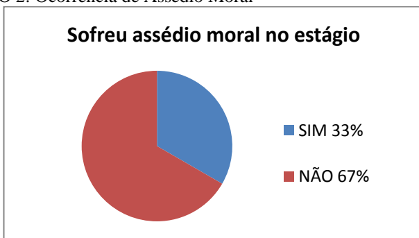
GRÁFICO 2: Ocorrência de Assédio Moral

Uma situação de estresse contínuo, mesmo que fundamentada a partir de uma alegação de competição ou concorrência por uma vaga efetiva não é saudável, trazendo malefícios imensuráveis para a formação de caráter de uma pessoa e para sua saúde, pois o estresse causa sintomas comprovados, como por exemplo: depressão, dor de cabeça, tontura e inúmeros distúrbios digestivos dentre outros muito mais graves. Para agregar consistência a essa discussão, foi feito levantamento dos alunos que dizem já ter sofrido assédio moral enquanto estagiários, e os números do gráfico abaixo reforçam o tudo o que foi exposto.