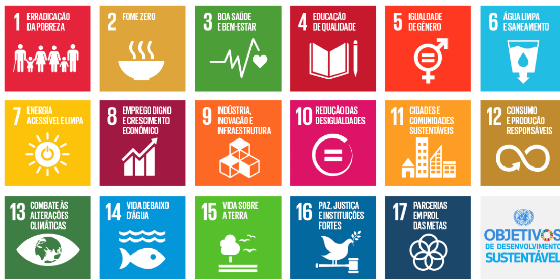
Figura 1: conjunto dos 17 Objetivos de Desenvolvimento Sustentável.

A seguir seguem o conjunto dos 17 objetivos ODS discriminados: