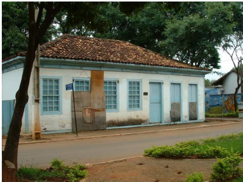
Figura 7: Museu Histórico e Artístico de Planaltina, antiga residência de Salviano Monteiro Guimarães