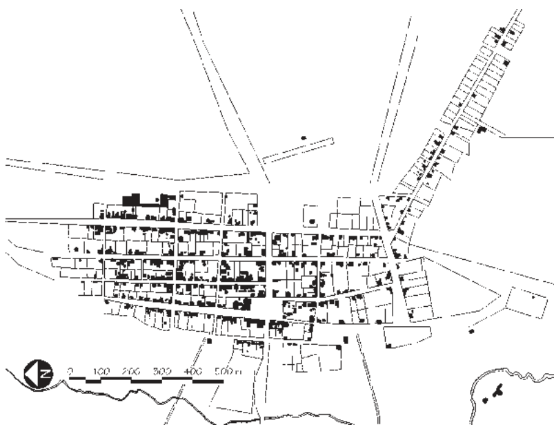
Figura 8: Malha urbana de Planaltina em 2012