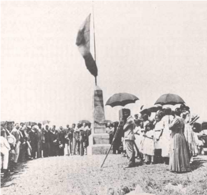
Figura 6: Lançamento da Pedra Fundamental no Morro da Independência