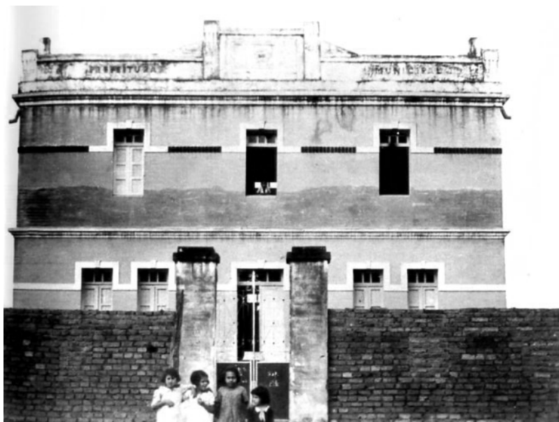
Figura 5: Paço Municipal, ou Casa de Câmara e Cadeia, de Planaltina, década de 1940