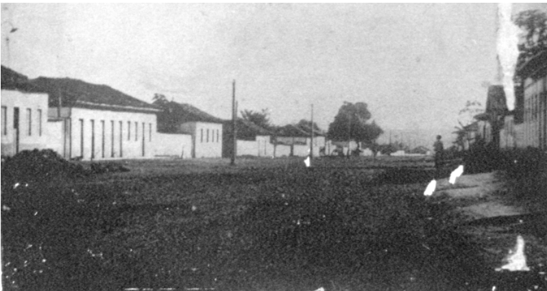
Figura 1: Vista de Planaltina no início do século XX

Planaltina é a única sede de município incorporada no perímetro do Distrito Federal quando da inauguração de Brasília, em 1960. Por isso, as identidades socioculturais construídas pela sociedade local desde então têm considerado essa dupla afiliação: de um lado, como vila centenária e parte da paisagem cultural goiana; de outro, como cidade-satélite de Brasília, reproduzindo as lógicas de apropriação da narrativa da modernidade.