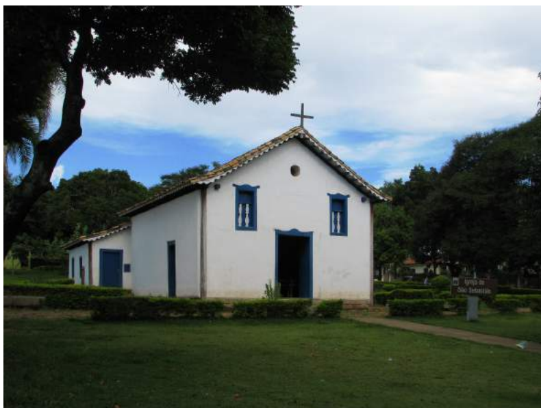
Figura 3: Capela de São Sebastião de Mestre d'Armas, construída em 1811, ampliada em 1880, reformada em 1911