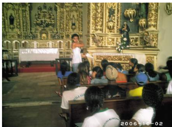
Figura 4: Observação e leitura dos altares