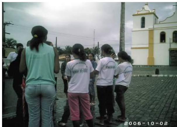
Figura 3: Leitura da Praça

Igreja, com exceção de um aluno, que mesmo sendo geruense, nunca tinha entrado no templo. Dessa forma, saímos do prédio escolar em direção a Igreja para estabelecer diálogo entre ela e a comunidade estudantil.