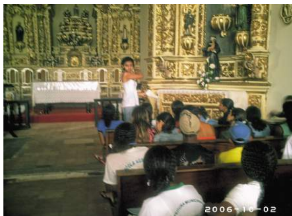
Figura 4: Observação e leitura dos altares