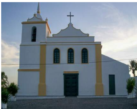
Figura 1: Fachada da Igreja N. Sra. do Socorro

município de Tomar do Geru. O edifício e todo o seu acervo estão tombados desde 1943 pelo Instituto do Patrimônio histórico e Artístico Nacional (IPHAN), inscritos nos livros de Tombo Federal: Livro Histórico, com o número 196; e o Livro de Belas Artes, com a inscrição 262-A.