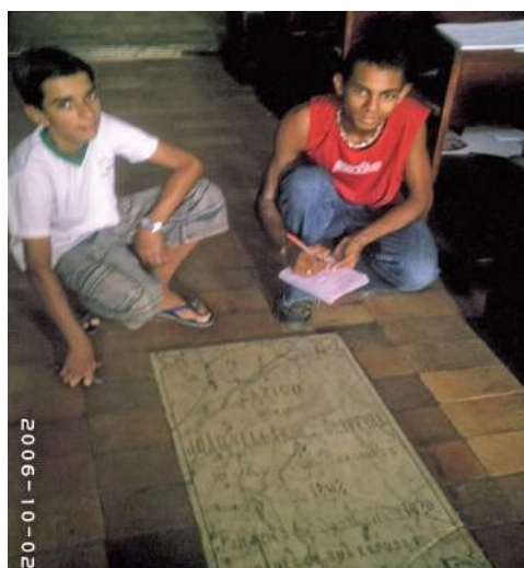
Figura 6: Investigação dos túmulos