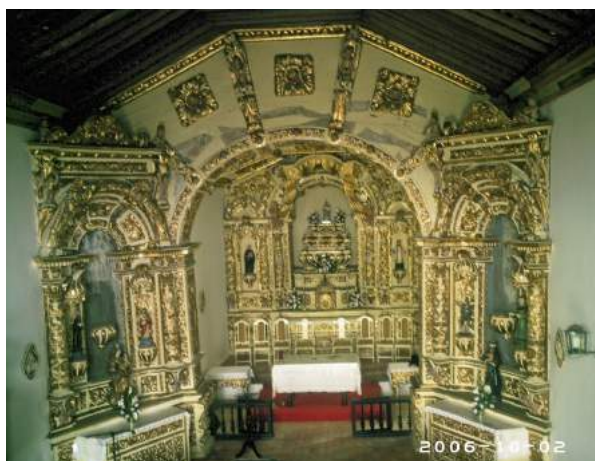
Figura 2: Altar-mor e altares laterais