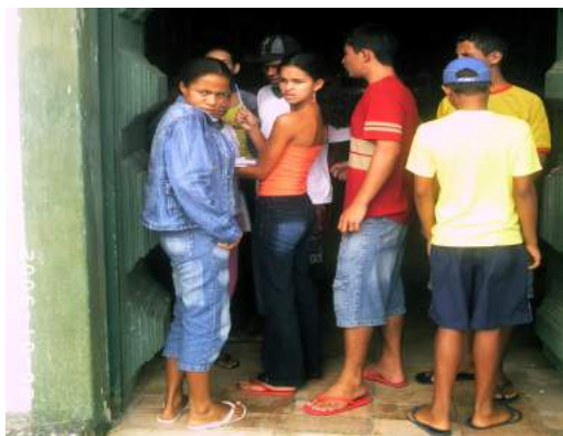
Figura 5: Caracterização da porta

visto e tocado, diferentes dos ocupantes do passado. Investigamos os materiais de construção, identificamos o estilo do monumento juntamente com portas, janelas, torre, pináculo, telhado, piso, túmulos, fechaduras, mobiliário e detalhes decorativos. Na oportunidade, os alunos registraram as informações em uma ficha de observação para caracterizar o edifício (Figura 5 e 6).