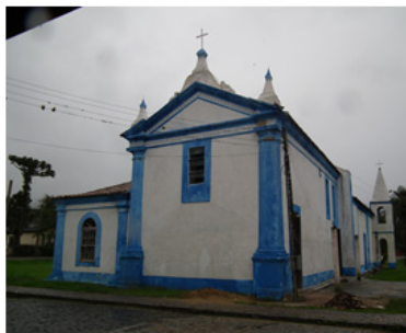
Imagem 2: Fachada Secundária da Igreja de São Sebastião de Porto de Cima/Paraná, construída no século XVIII