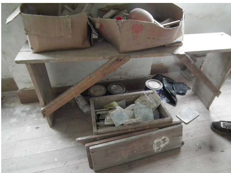
Imagem 8: Caixa com azulejos descartados na restauração

Por fim, cabe destacar que, por meio dessa história - no mínimo, singular -, foi possível inventariar e conhecer em detalhes aspectos dessa igreja curiosamente dotada de duas “cabeças”. A inconclusa reforma e a dupla fachada acabaram revelando meandros e sinuosidades de uma relação tríade que se estabeleceu entre a população, o poder público e um templo religioso, ao longo de três séculos.