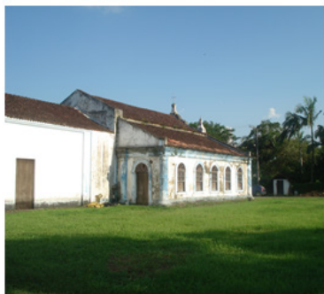
Imagem 3: Lateral da Igreja de São Sebastião de Porto de Cima/Paraná