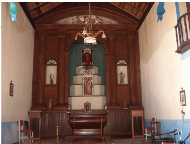
Imagem 6: Altar-Mor, Igreja de São Sebastião de Porto de Cima/Paraná