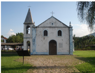
Imagem 1: Fachada Principal da Igreja de São Sebastião de Porto de Cima/Paraná, construída no século XIX