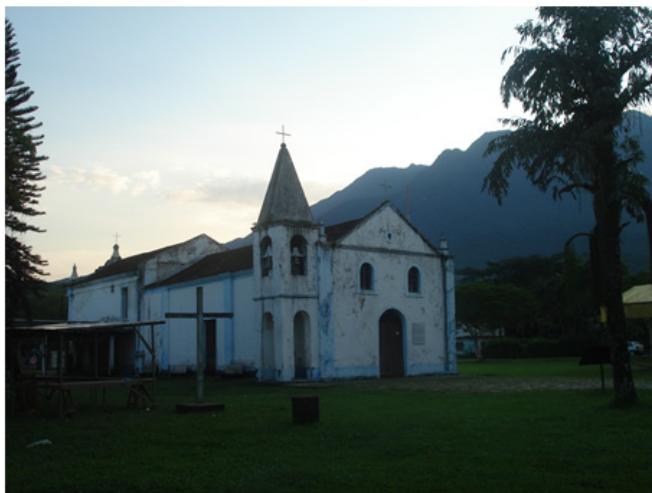
Imagem 5: Igreja de S. Sebastião de Porto de Cima com a fachada do século XIX e o corpo da igreja do XVIII, que não foi demolido