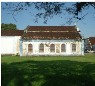
Imagem 4: Sacristia da Igreja de São Sebastião de Porto de Cima/Paraná