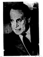
Um dos seus recentes entrevistados, o novo Presidente Interino dos Estados Unidos do Brasil, Kubitschek de Oliveira.

VAI PARA O URUGUAI QUE LHE CONCEDEU ASILO POLÍTICO