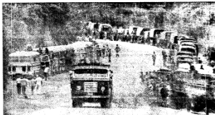
Uma coluna de soldados da Misão Coreia e comitiva de Rio de Janeiro, no início da greve que depôs Goulart.