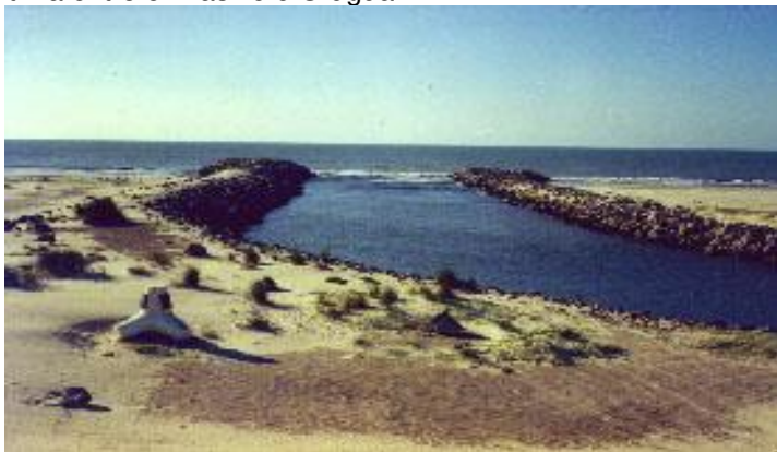
FIGURA 1 – Barra do Arroio Chuí - fronteira Brasil-Uruguai

1969, pois os trabalhos estiveram suspensos por mais de cinco anos devido ao projeto de aproveitamento, pelo Brasil, da energia no Salto das Sete Quedas, problema solucionado pela Ata das Cataratas, firmada em Foz do Iguaçu em 1965. A assinatura do Tratado de Itaipu, em 1973, ensejou a construção da Barragem e da Hidrelétrica de Itaipu e a consequente criação de um lago artificial com área aproximada de 1400 km 2 . Ainda pende de definição, o limite internacional ao longo desse lago; (e) Argentina: suspensas desde 1928, as operações nessa fronteira foram retomadas em 1971 com a criação de nova Comissão Mista, para inspeção dos marcos, a qual realizou, nas décadas de 1970 e de 1980, o levantamento minucioso do divisor de águas entre as nascentes dos rios Peperi-Guaçu e Santo Antônio (único trecho de fronteira seca ao longo dessa raia) e procedeu à intercalação de 260 novos marcos terciários; e, (f) Uruguai: - como resultado de ampla negociação entre as Chancelarias, com assessoramento das Comissões de Limites, foi assinado, em 1972, um acordo estabelecendo a fixação da barra do Arroio Chuí (com construção, pela Portobras, dos molhes, em 1978), cujo leito era instável, desde a primeira demarcação na década de 1850, definindo a Divisória Lateral Marítima entre o Brasil e o Uruguai.