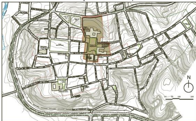
Figura 5 – Cartografia do centro histórico de São Cristóvão (limites da Praça São Francisco)

Nas ações de requalificação da Praça São Francisco e de seu entorno, o Programa Monumenta 1 disponibilizou uma linha de financiamento para os proprietários que possuem imóveis dentro da área objeto de investimento do Programa. O Monumenta foi responsável ainda pelo fomento para a obra de conclusão da rede elétrica e telefônica subterrânea no centro histórico, a iluminação de valorização do conjunto histórico da Praça São Francisco, a recuperação da antiga pavimentação em pedra calcária e incorporação de novo mobiliário urbano e equipamentos nas Ladeira do Porto da Banca, Ladeira do Açougue e Ladeira de Epaminondas. Também o Largo do Rosário e Largo do Amparo receberam melhorias na pavimentação e iluminação para valorização dos monumentos, houve a restauração do Lar Imaculada Conceição (antiga Santa Casa da Misericórdia) e a obra de restauração da antiga Delegacia para ao Museu da Polícia Militar e, com recursos do BNDES, a restauração da Igreja Matriz de Nossa Senhora das Vitórias (UNESCO, 2010, p.25).