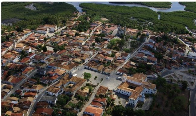
Figura 1 – Vista aérea do Centro Histórico com a Praça São Francisco, São Cristóvão, SE.