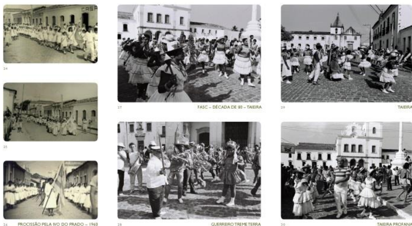
Figura 2 – Grupos culturais em celebrações no centro histórico de São Cristóvão, SE

A praça São Francisco, ao ser ocupada nas celebrações pelos grupos culturais com múltiplas identidades étnicas (fig. 2) que expõem as ancestralidades africanas e indígenas, mantêm a resistência daqueles que sobreviveram à escravização e extermínio de seus ascendentes nos períodos da Colônia e Império, aos trabalhos subalternos e à precariedade de condições de vida financeira e educacional na República Velha e Nova, ao racismo estrutural que perpassa a formação da Nação e impacta as novas gerações na contemporaneidade.