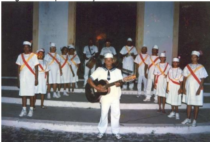
Figura 6 – Grupo São Gonçalo do Amarante de São Cristóvão.