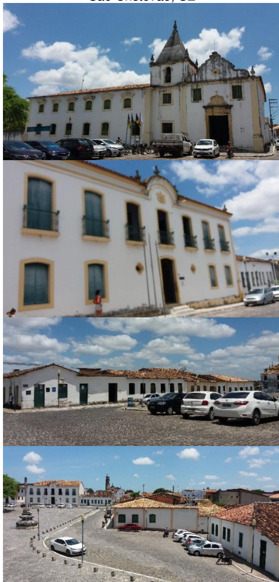
Figura 4 – Praça São Francisco e suas edificações, São Cristóvão, SE