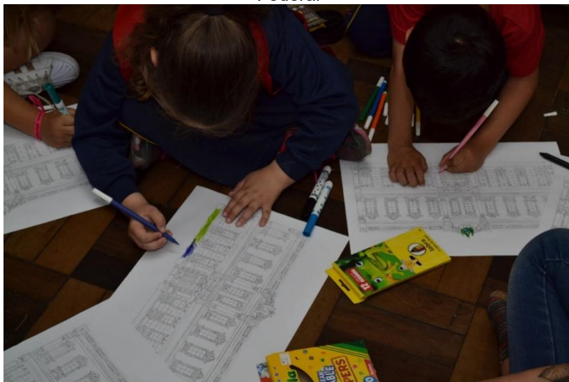
Figura 10 – alunos pintando a fachada do prédio-sede da Polícia Federal