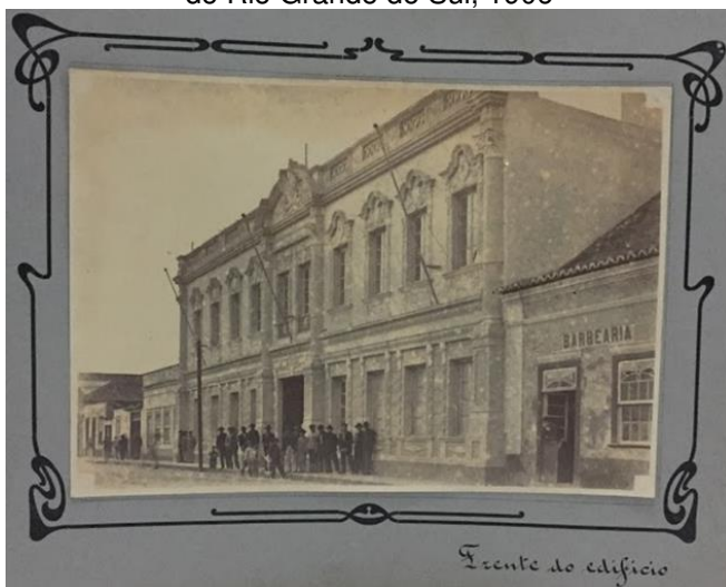
Figura 4 – Lembrança da Comissão das Obras da Barra e do Porto do Rio Grande do Sul, 1906