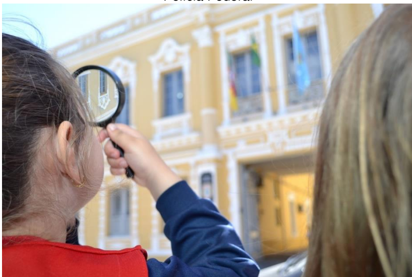
Figura 9 – Crianças realizando a “leitura” do prédio-sede da atual Polícia Federal