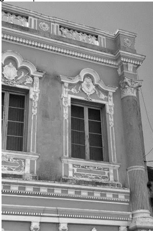
Figura 5 – prédio-sede atual da Polícia Federal