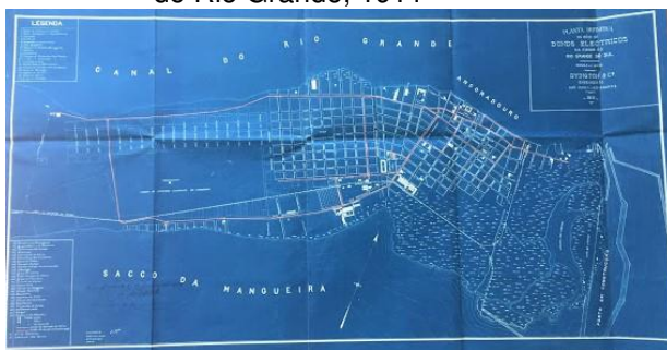
Figura 3 – Planta da Rêde de Bonds Elétricos Electricos da Cidade do Rio Grande, 1911