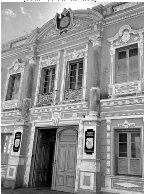
Figura 6 – prédio-sede atual da Polícia Federal (detalhes da fachada)