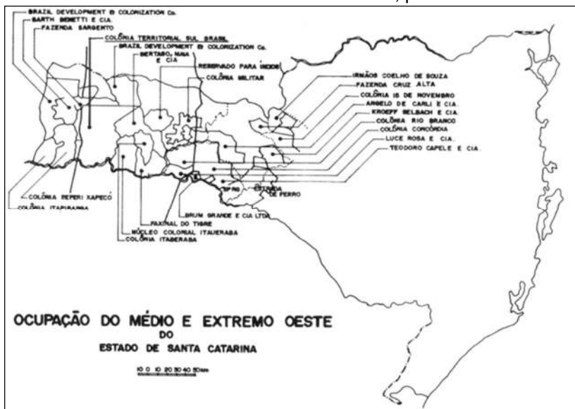
Mapa 3 – Ação das colonizadoras e a confecção de colônias no Médio e Extremo – oeste de Santa Catarina, por volta de 1930

e concretizariam a nova dinâmica de exploração das terras. Ao estado de Santa Catarina interessava assegurar a regulamentação da terra, o ordenamento social, a produção de excedentes e a obtenção de divisas financeiras com a intermediação mercantil dela e dos frutos do trabalho gerados pelo extrativismo e a produção agrícola. A política do governo era constituir núcleos populacionais agrícolas, legitimando seu poder de força e coerção caso fosse alvo de reivindicações territoriais ou de lutas sociais (VICENZI, 2008). A atuação das companhias colonizadoras seguia um padrão da política de exploração, propagando as vantagens que podiam encontrar em Santa Catarina. A figura a seguir mostra a configuração das áreas das companhias colonizadoras no Médio e Extremo oeste do estado na década de 1930 com a efetivação de várias colônias e mediação de colonizadoras. Foi um intenso período de redefinição agrária e agrícola dessa porção do estado; essa macrorregião foi fatiada, a partir da década de 1930, pelas colonizadoras.