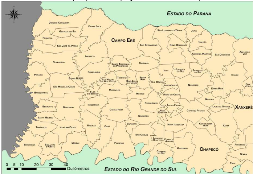
Mapa 1 – Localização do Oeste e Extremo-oeste de Santa Catarina, com destaque para o espaço de estudo, Campo Erê