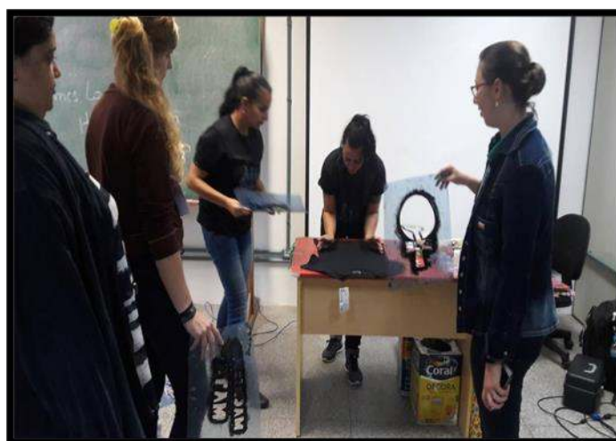
FIGURA 2: Oficina no III Seminário das Mulheres do Campo, das Águas, Florestas e Cidades, no ano de 2017.