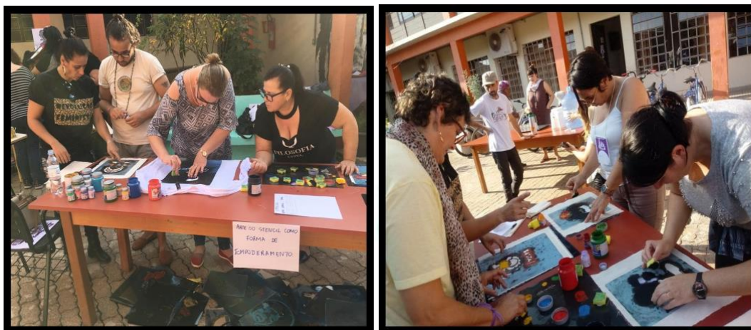
FIGURA 3: Oficina Realizada no IV Seminário das Mulheres do Campo, das Águas, Florestas e Cidades, no ano de 2019