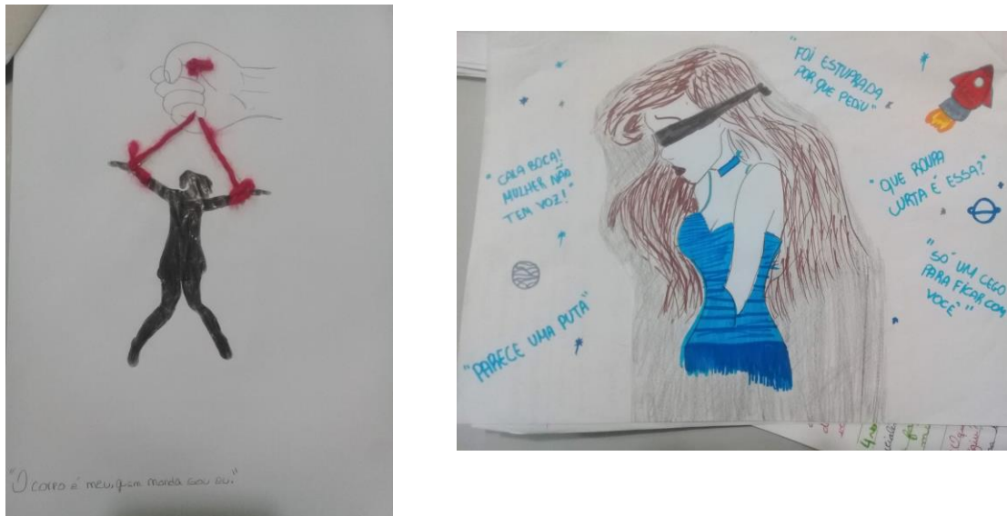
Figura 2- Desenhos produzidos pelos/as estudantes

Os/as estudantes também confeccionaram desenhos sobre a conscientização da violência doméstica feminina que foram expostos no mural na escola.